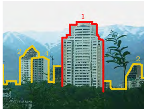
شکل ۲- بافت شهری شمال تهران