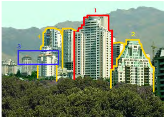
شکل ۳- بافت شهری شمال تهران