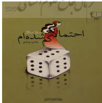
شکل ۲. جلد رمان

جلد کتاب چهره زنی نشسته بر روی تاس را به تصویر کشیده است که با عینک آفتابی به آسمان خیره شده است. راوی داستان، نشسته بر تاس تقدیر و با توسل به سایه تقدیر، به تغییر خود چنگ می‌زند. سایه گذشته را باید به زمان حال بیاورد، اما نه تمام و کمال، بلکه آن بخشی از گذشته را که راوی به آن چنگ زده است. تاس تقدیر راوی زن بر اعداد شش‌ترسیم شده است، اما در سایه آن، نه تمام سه بُعد، بلکه دو بُعد آن به تصویر درآمده است. در واقع، راوی داستان باید با دقت و سواس‌آلود خود گم‌شده‌اش را در آسمان گذشته به زمان حال بیاورد؛ این‌گونه است که بر تقدیر فائق خواهد آمد، دچار تغییر خواهد شد، از گم‌شدگی نجات پیدا خواهد کرد و با گذشته خود دوباره آشتی خواهد کرد: «انگار سال‌ها پیش گم شده‌ام، گم شده‌ام توی آن آسمان سیاه پرستاره زاهدان.» (ص ۹۵) در جایی از کتاب، اشاره می‌کند که این تقدیر من است. در واقع، تقدیر این زن تغییرش است: «توی دلم می‌گویم تغییر می‌دهم، حتی اگر این تغییر هم تقدیر باشد.» (ص ۱۲۸)