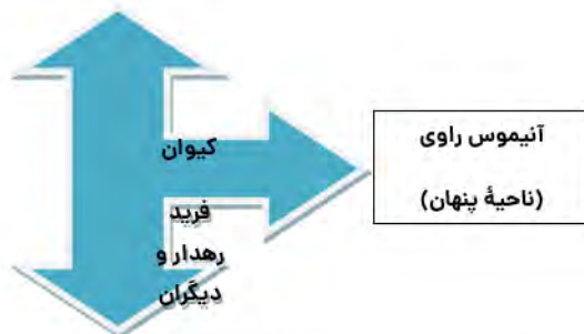
شکل ۴. روابط اجتماعی (ناحیه پنهان) بر محور آنیموس

می‌ریزد که مجبور به انتخاب شود و سردرگمی پیش می‌آید. اگر فقط فرید رهدار باشد، راوی پس‌زده می‌شود و اگر فقط کیوان باشد، گندم پس‌زده می‌شود. پذیرش گندم راوی را از گم‌شدگی نجات می‌دهد و به تعادل می‌رساند؛ تعادلی که در چال گونه‌های گندم نهفته است: هم این، هم آن.