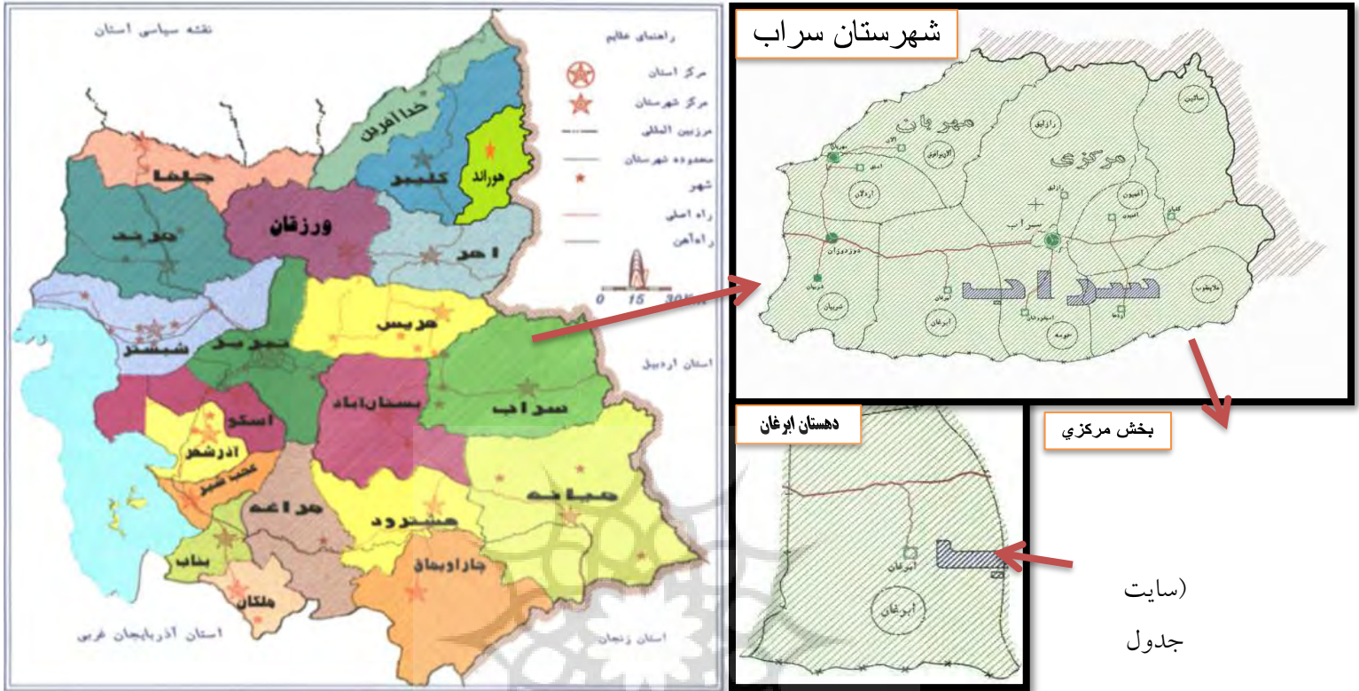
نقشه شماره (۱) موقعیت دهستان ابرغان در استان و شهرستان

پژوهشگاه علوم انسانی و مطالعات فرهنگی پرتال جامع علوم انسانی