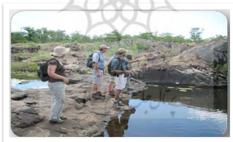
تصویر شماره ۴: نمایی از برگزاری اکوتوریسم تور در محل آولانی اکوتوریسم پارک