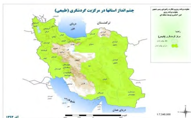
تصویر شماره ۶: نقشه چشم اندازهای طبیعی استان های ایران