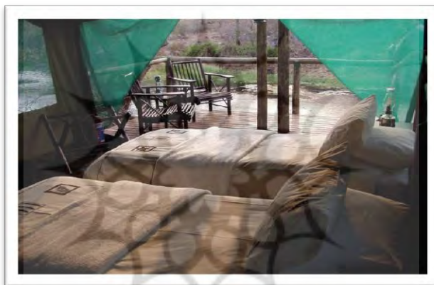
تصویر ۵: نمایی از اقامتگاه بوم گردی در اولانی اکوتوریسم پارک

این پارک طبیعت گردی از دو بخش - زون - مجزا تشکیل شده است؛ بخش پراکنده و بخش متمرکز. بخش پراکنده این پارک را عرصه های طبیعی بکر تشکیل داده است که حیات وحش در آن آزادانه زندگی می کنند و بخش متمرکز با برپایی اقامتگاه بومی، رستوران و سرویس بهداشتی نیاز اولیه گردشگران را فراهم می آورند . در طراحی این پارک تلاش شده است تا زون متمرکز با فاصله ای متناسب از عرصه طبیعی، علاوه بر حفظ چشم انداز و بوم منطقه، خود به محلی برای تماشای سایر جاذبه های طبیعی موجود همانند تماشای غروب خورشید، آب خوردن حیات وحش، پرواز پرندگان و ... تبدیل شود .