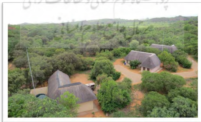
تصویر شماره ۲: نمایی از اولانی اکوتوریسم پارک