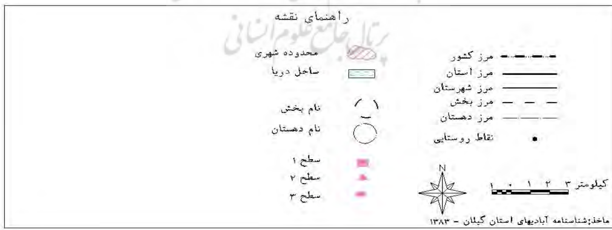
نقشه ۱: سطح بندی روستاهای شهرستان آستارا به روش موریس