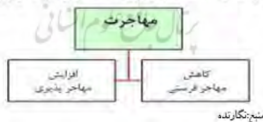
شکل شماره ۳): شاخصهای مورد مطالعه در مهاجرت در این تحقیق

این مسئله موقعی مشکل ساز می شود که مهاجر فرستی و مهاجر پذیری بدون برنامه و بی رویه باشد و باعث خالی شدن جمعیت یک نقطه و افزایش بی رویه جمعیت نقطه دیگر شود که این امر مشکلات خاص خود را از لحاظ اقتصادی و اجتماعی در بر خواهد داشت. در هر برنامه ای که برای مناطق علی الخصوص نقاط روستایی تدوین و اجرا می شود مسئله مهاجرت باید به طور خاصتر مورد توجه قرار گیرد تا باعث مهاجر فرستی و مهاجر پذیری بی رویه نگردد.