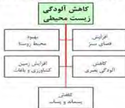
شکل شماره ۴): شاخصهای مورد مطالعه در کاهش آلودگی زیست محیطی در این تحقیق