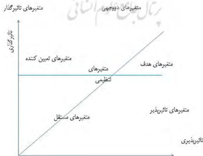
شکل ۲. نمودار تاثیر گذاری - تاثیر پذیری

نحوه توزیع و پراکنش عوامل نیز از میزان پایداری و ناپایداری سیستم حکایت می کند. در مجموع دو نوع پراکنش تعریف شده است که به نام سیستم های پایدار و ناپایدار معروف هستند. در سیستم های پایدار پراکنش عوامل به صورت L انگلیسی نشان داده شده است، یعنی برخی عوامل دارای تاثیر گذاری بالا و برخی دارای تاثیر پذیری بالا هستند. در سیستم های ناپایدار متغیرها حول