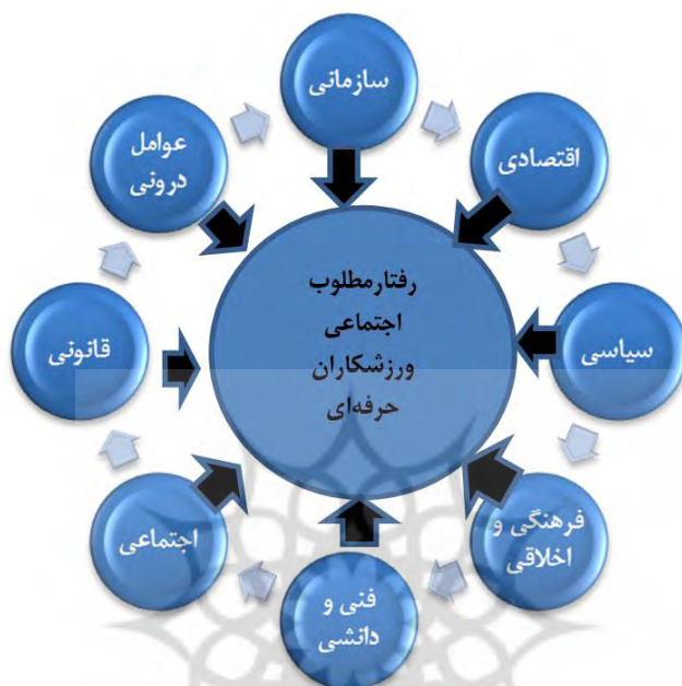
شکل ۳. حوزه‌ها و عوامل موثر بر شکل‌دهی رفتارهای اجتماعی ورزشکاران حرفه‌ای ایران

کدگذاری انتخابی، مرحله اصلی نظریه پردازی داده بنیاد است که محقق بر اساس نتایج کدگذاری باز و محوری به ارائه نظریه می‌پردازد. در جامعه ورزش کنونی شناسایی حیطه‌ها و عوامل موثر بر شکل‌دهی رفتارهای اجتماعی ورزشکاران حرفه‌ای ایران؛ اکتشاف، فرایندها، ساختارها و پارادایم‌های خاصی را می‌طلبد؛ در فرایند شناسایی حیطه‌ها و