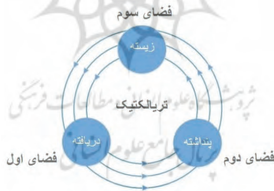
شکل ۳: انطباق تریالکتیک فضایی سوچا با لوفور (مأخذ: Li and Zhou, 2018)