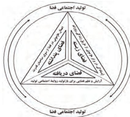
شکل ۱. مدل سه‌گانه فضایی و ماتریس تولید اجتماعی فضا

دیالکتیکی بین عمل فضایی و بازآمدهای فضا ظاهر می‌شوند (لوفور، ۱۹۹۱). در واقع فضاهای بازآمدهایی شده شامل نمادگرایی‌های پیچیده و گاهی رمزگذاری شده‌ای است که با ابعاد پنهان زندگی اجتماعی پیوند خورده است؛ این فضا واجد تجربه مستقیم و زیسته افراد یا همان نموده‌های زندگی روزانه افراد است (حبیبی و برزگر، ۱۳۹۷) (شکل ۱).