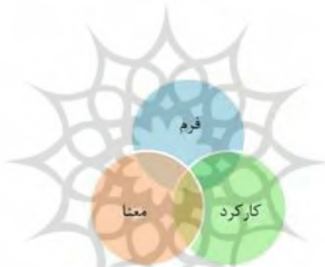
نمودار ۲. مقوله‌های مؤثر در طراحی معماری (نگارنده)

گروهی دربارۀ انواع نشانه‌ها و منبعث از آن اشاره می‌کند. نشانه‌ها در معماری دارای ساختارهای متعددی هستند که عبارت‌اند از: ۱- نقش‌ها ۲- شکل معماری ۳- علامت روشن ۴- استعاره ۵- نماد. دربارۀ نمادها معتقد است که به دو نوع باواسطه و بی‌واسطه دسته‌بندی می‌شوند. در این میان نقش‌ها دارای ویژگی‌های متعددی در معماری هستند که عبارت‌اند از فرم، اندازه، رنگ و همواره به‌عنوان یک علامت ظاهری به‌کار می‌روند. دربارۀ شکل معماری باید اذعان کرد که گویای مفهوم و محتوای، نشانه گفتگو و از روابط بین علامت و محتوا پدید می‌آید. در رابطه با علامت روشن برای درک آن نیز به دانش قبلی در این زمینه داریم. در رابطه با استعاره باید گفت تطابق تجربیات با شکل، تابع شخص بیننده و محیط فرهنگی بیننده است که براساس تجربیات خود معمار را وادار به طراحی بهتر فرم و شکل می‌کند که می‌تواند شکل فضای داخلی و خارجی را با آن هماهنگ کند. دربارۀ نمادها باید گفت بیانگر محتوای ذهنی، احتیاج به شناخت قبلی برای درک آن و وابسته به فرهنگ هستند (Grutter, ۲۰۱۰, pp. ۵۰۱-۵۲۳).