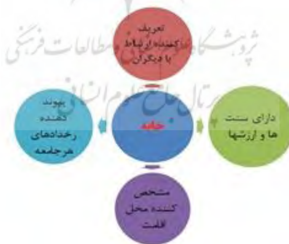
نمودار ۱. مفهوم خانه (نگارنده)

اغلب نظریه‌پردازان حوزه معماری بر این باورند که فرهنگ یکی از عوامل مؤثر در طراحی خانه است. پیکره‌بندی فضایی خانه در یک منطقه فرهنگ ساکنان را حمایت یا مختل نماید. از این رو شکل خانه در معماری بومی بیان درک محتوای زندگی است (بازایی و همکاران، ۱۳۹۹: ۱). خانه هویت خود را دارد، ارتباط با دیگران را تعریف می‌کند و تداوم سنن و ارزش‌ها را در خود جای می‌دهد. خانه بسیار گسترده است و می‌تواند مکانی خاص، محل اقامت، یک ساختمان، محله، شهر یا یک کشور باشد که حس‌ها، صداها، رایحه‌ها و رخدادها هر جامعه و زندگی‌ها را به هم پیوند می‌دهد. جایی که ما با بودن در آن تصور می‌کنیم دنیا در آینده نیز همان‌گونه خواهد بود که در گذشته بوده است (امین‌زاده، ۱۳۹۴: ۱۱۱).