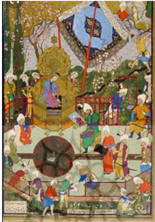
تصویر ۳: نگاره نشان دادن تصویر شیرین به خسرو، خمسه طهماسبی، دوره صفوی.

بنابراین نگاه نظامی به زن عاشق آنچنان با احترام و ارزش است که زیباترین ترکیبها و تصویرها را در باب او به کار می‌گیرد. زن عاشق در سبک فکری نظامی بی‌اراده و تسلیم محض معشوق نیست و این برخلاف زن عاشق دوبووار است که چهره‌ای خاضع و مطیع دارد. نظامی بر پاک نگه داشتن زنان قصه‌اش مصمم است و پاکدامنی را فضیلتی برای زن بر می‌شمرد. آن چنان که در اولین دیدار خسرو و شیرین در کنار چشمه، با وجود آنکه خسرو در قید و بند اخلاق نیست، او را با شرم روبه‌رو می‌کند و لحظه‌ای بداندیشی را در ذهن مخاطب پدید نمی‌آورد. حیا که ویژگی زن عاشق در این اثر است، از باور پاکی است که نظامی نسبت به زن دارد و شیرین را در پرده عصمت می‌پوشاند تا جایی که او برای دورماندن از هر اتهامی از صحنه‌های خلوت پرهیز می‌کند.