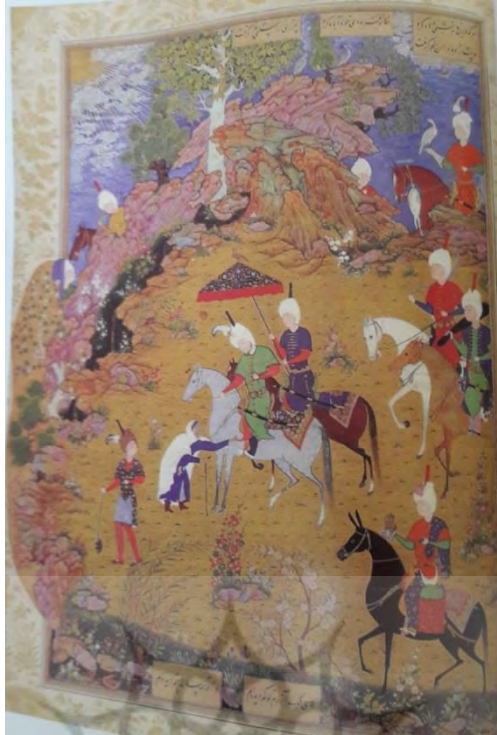
تصویر ۱: نگاره پیرزن و سنجر. خمسه نظامی. دوره صفویه، مکتب تبریز. قرن دهم هجری. (منبع: کنبای، ۱۳۸۱: ۸۰)

منظومه خسرو و شیرین که شادکامی و عشرت‌طلبی شاهی به نام خسرو پرویز را به تصویر می‌کشد و عفاف و درخشندگی شخصیتی به نام شیرین را نشان می‌دهد، شاید روایت‌گر عشق از دست‌رفته نظامی یعنی «آفاق» همسر او باشد و او این چنین مرهمی بر درد فراق خود می‌گذارد. نظامی غرور و زیبایی و خویش‌تنداری و قدرت و صلابت زنانه را در لوای شخصیت‌های قهرمانی چون شیرین، مهین بانو، شکر و مریم به رخ جهان‌نیان می‌کشد. در سومین منظومه نظامی، لیلی و مجنون، نظامی پنجاه‌ساله که از درد فراق مادر خود نالان است، در این اوضاع و احوال به سرایش غم‌نامه لیلی و مجنون می‌پردازد. او در این منظومه سراغی از چنگ و بزم و رباب نمی‌گیرد؛ بلکه می‌کوشد به زن مقام معنوی بدهد» (ممیزی، ۱۳۹۲: ۳۲).