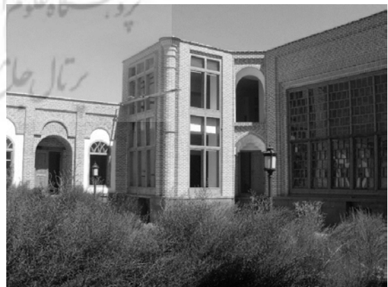
تصویر ۶ و ۵: نمای خانه صادقی.

ساختمان دارای نمای آجری است که روی دیوارهایی با آزاره سنگی به ارتفاع یک متر استوار شده است. تالار که بخش مهمی از بنا را تشکیل داده است، شامل دو رواق و یک شاه‌نشین است که با پنجره‌های مشبک ریز با شیشه‌های الوان به‌صورت ارسی زیبا تزئین یافته است. از جمله تزئینات به‌کاررفته در تالار این بنا می‌توان به