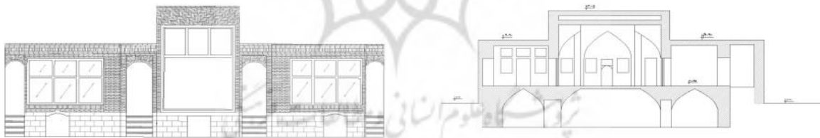
تصویر ۲: نمای خانه ابراهیمی.

در شهر اردبیل نیز مهم‌ترین ویژگی سازمان فضایی خانه‌های سنتی، حیاط مرکزی به‌عنوان فضای باز و طبقات ساختمان به‌عنوان فضای بسته است. هر یک از این فضاها با توجه به کاربرد آن مورد استفاده ساکنان قرار گرفتند. حیاط به‌عنوان فضایی ارتباط‌دهنده در مرکز خانه‌های سنتی اردبیل قرار می‌گرفت. این فضا در اکثر مواقع به‌صورت پلان چهارگوش با هندسه مشخص ساخته و طراحی شده است که نمونه‌های آن در زیر می‌آید.