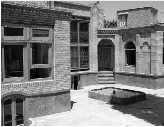
تصویر ۴: خانه ابراهیمی اردبیل.