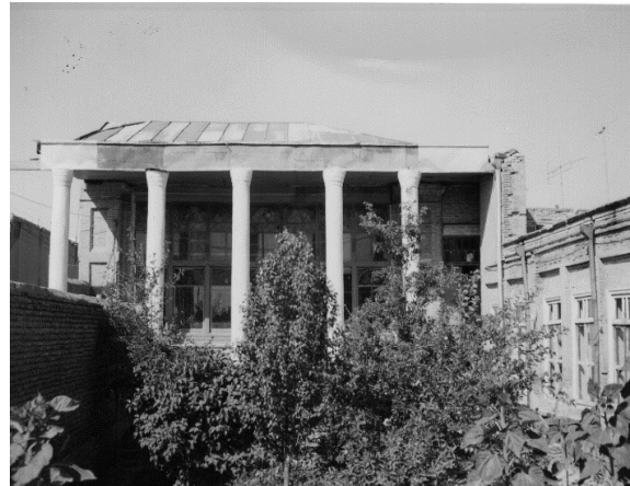
تصویر ۳: ورودی خانه وکیل.

در دسته‌بندی پلان‌های خانه‌های مسکونی اردبیل الگوهایی وجود دارد که یکی از این الگوها الگوی خطی است. در این الگو خانه در یک سمت زمین قرار می‌گیرد و حیاط در سمت دیگر. به‌عنوان مثال خانه وکیل در محله، طوری که در جلوی خانه نیز ایوان بزرگی قرار گرفته است. در این الگو که اکثر خانه‌های بومی اردبیل نیز بر این اساس ساخته شده، ارتباط بین فضای داخل و خارج خانه از طریق ایوان مقدور است. در این ترکیب همچنین در ورودی اصلی ساختمان از دالان نیز استفاده نشده است. این نوع پلان‌های خطی در تمام مناطق ایران وجود دارند. یکی دیگر از الگوها که در خانه‌های سنتی اردبیل استفاده شده، الگوی U شکل است که در خانه ابراهیمی دیده می‌شود. عمارت اصلی بنای مذکور که شامل دو طبقه همکف و زیرزمین است، دارای تالار نسبتاً بزرگ و زیبایی است و با یک فضای هشتی کوچک از معبر کوچه وارد حیاط مستطیلی می‌شود.