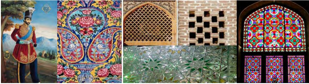
تصویر شماره دو- تزئینات بکار رفته شده در معماری دوران قاجار

هفت رنگ و لعاب‌های رنگارنگ، نمای داخلی گچ‌بری و کاشی‌کاری، استفاده از آرایه‌های چوبی در تزئینات، شیشه‌های رنگی، نقاشی‌های لندن کاری، استفاده از آجر تزئینی قالبی و تراش مخصوص دوره قاجار، استفاده از تزئینات آئینه‌کاری، استفاده از کاشی منقوش و نقش دار (نقوش اساطیری کهن و درباری)، استفاده از قواره آجر تراش در تزئینات مکان‌های مذهبی، رسمی‌بندی و کاربرندی از جمله تزئینات قاجاری هستند (نظر بلند، ۱۳۹۶: ۸). (تصویر شماره دو)