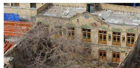
تصویر شماره شش - خانه امیری در شهر مشهد