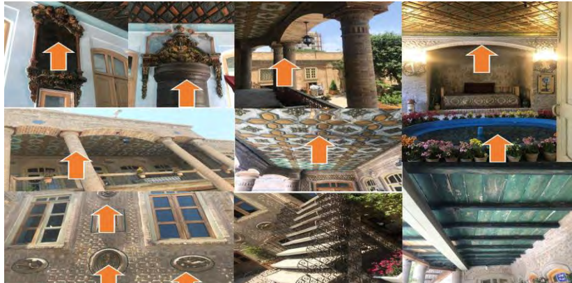
تصویر شماره ۹-خانه داروغه

البته مؤلفه‌های که می‌توان در این نمونه‌ها به آن‌ها اشاره کرد فراتر از مواردی هستند که به آن‌ها پرداخته شده‌اند که شامل اتاق مرکزی با اتاق‌های کوچک در اطراف آن تبدیل سه دری به دو دری و وارد شدن نور مستقیم به داخل بنا، محوطه‌سازی با سطوح وسیع، ایجاد زیرزمین با طرح‌های زیبا و پوشش ضریبی آجری - آئینه‌های قدیمی با گچ‌بری، حوضچه‌ها و حوض‌های مربع مستطیل، نقاشی دیواری با موضوعات مختلف، ایجاد چشم‌انداز وسیع توسط پنجره‌ها، تنوع، سبکی و گشایش فضاها، آذین‌بندی فضای داخل - پلان کشیده در امتداد بنا و... می‌باشند که با توجه به مطالعات و تطبیق‌های صورت گرفته اهم آن ذکر شد البته در زمینه تزئینات سایر مؤلفه‌ها کشف و شناسایی شد که در ادامه به بررسی آن‌ها در قالب جدول زیر می‌پردازیم. باید متذکر شد که تحولات و نوگرایی در هنر نقاشی قاجاریه ریشه در دوران صفویه دارد، اما در دوران قاجار نسیم تغییرات شروع به وزیدن می‌نماید. هنر نقاشی، مجسمه‌سازی و تزئینات قبل از هنر ساختمان‌سازی تحت نفوذ هنر غرب قرار گرفت. وجوه معماری که از دوران صفوی در معماری ما جریان داشته و هم اکنون نیز در بناهای دوره قاجار قابل مشاهده می‌باشد شامل؛ کاشی هفت رنگ و معرق، آجرکاری، گچ‌بری و آرایه‌های چوبی می‌باشد که در خانه‌های مورد مطالعه بررسی شده است. (جدول شماره سه)