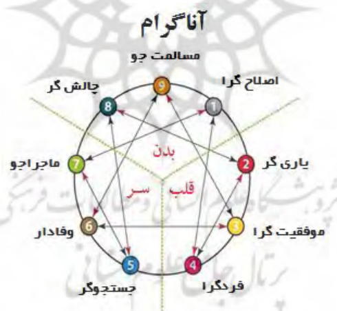
جدول شماره ۱: محاسن شخصیتی تپ‌های نه‌گانه آناگرام

بر اساس نظریه آناگرام، شخصیت افراد به نه دسته یا تپ تقسیم می‌شود که از آن‌ها تپ‌های شخصیتی یاد می‌شود. هر فرد (بعد از بیست سالگی) یک تپ شخصیتی دارد که در طول عمر تغییر نمی‌کند؛ اما درون همان تپ شخصیتی می‌تواند مراحل مختلف رشد انسانی (مراحل سالم، متوسط و ناسالم) در نوسان باشد. نماد آناگرام به شکل دایره‌ای است که نه نقطه روی آن با فواصل یکسان با نه خط به هم وصل شده است. هر یک از این نقاط بیانگر یکی از نه شخصیت اصلی است (Sutton, 2012: 5).