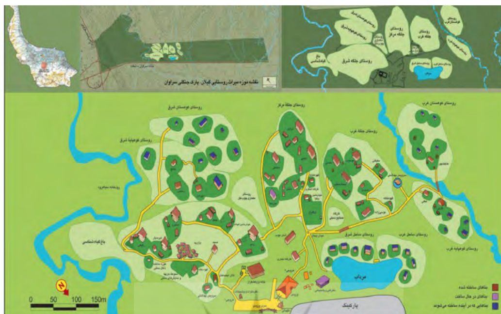
شکل ۲: وضع موجود سایت پلن موزه میراث روستایی گیلان، سراوان

از موزه عبارت بود از: ۸ عامل و ۳۱ گویه (مبتنی بر مبانی و ادبیات که پیش تر در جدول ۲ گزارش شد) و متغیر تمایلات رفتاری شامل ۳ گویه (بازدید مجدد (BI1)، توصیه شفاهی به دیگران (BI2) و حساسیت نداشتن به افزایش ورودیه (BI3) (تاج زاده نمین، ۱۳۹۷؛ رهبری پور و همکاران، ۱۳۹۷). روایی پرسش نامه از طریق روایی صوری تأیید شد. همچنین پایایی پرسش نامه با استفاده از پیش آزمون (۳۰ مورد اولیه از نمونه) از طریق آزمون آلفای کرونباخ ( \alpha = 0/916 ) بررسی و تأیید شد. داده ها در دو سطح توصیفی و استنباطی (آزمون فرضیه ها) تحلیل شدند. طبقه بندی و تحلیل داده ها با استفاده از نرم افزار اسپس اس اس ۲۲ انجام شد.