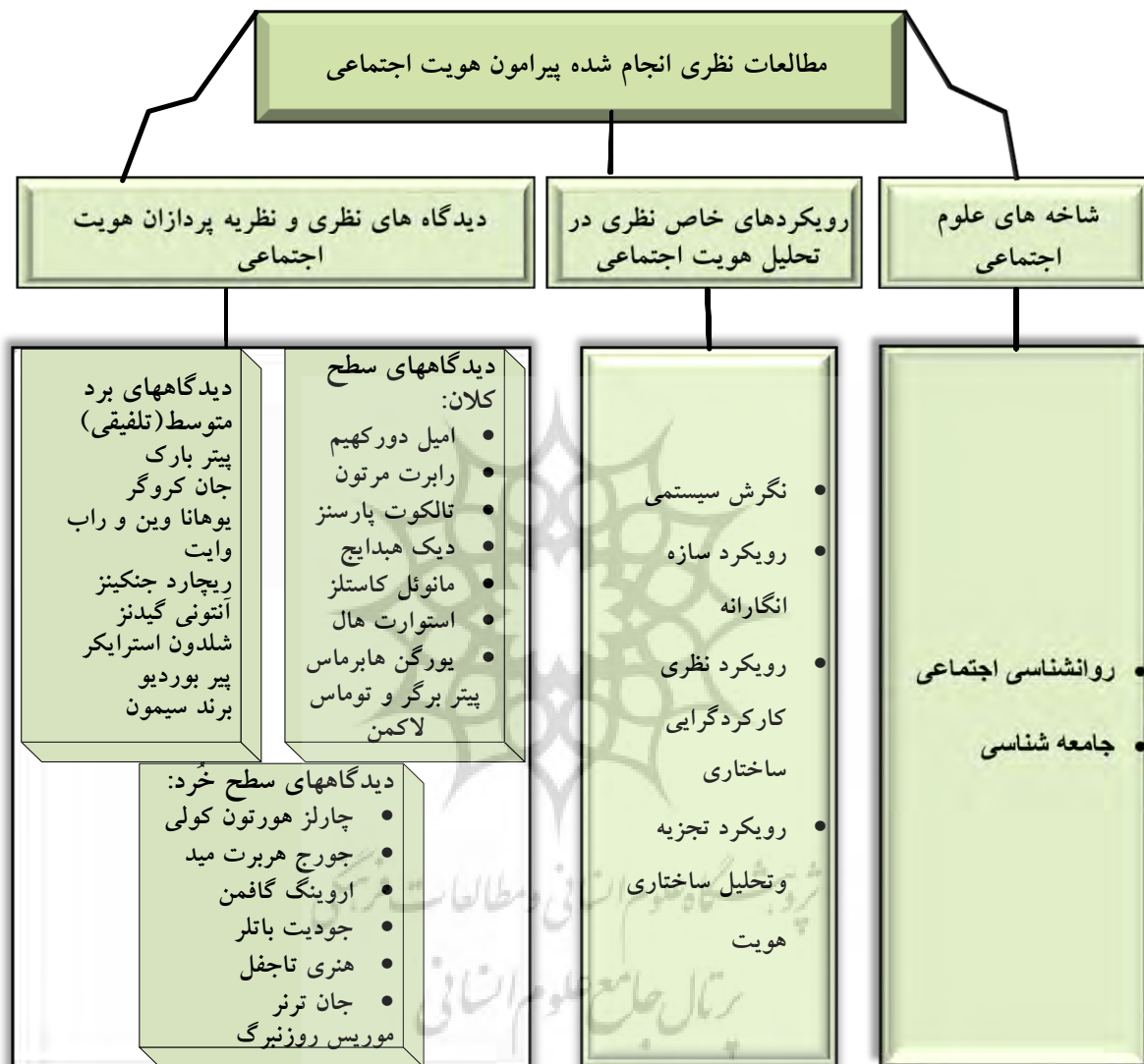
شکل ۱. نمودار مطالعات نظری انجام شده پیرامون هویت اجتماعی (اشرفی، ۱۳۹۸، ص. ۱۲۲-۶۵)

مرور کلی مطالعات نظری انجام شده در حوزه‌های علوم اجتماعی و رویکردهای مختلف نظری در بررسی و ارائه تعریف از هویت اجتماعی نشان از نوعی پراکندگی و اعوجاج نظری و کاربردی دارد که دست‌یابی به یک تعریف روشن و مشخص از هویت اجتماعی را دچار مشکل کرده است؛ زیرا هر کدام از مطالعات انجام شده در چهارچوب نظری مکاتب علمی خاص خودشان محصور بوده است. از آنجاکه بررسی‌های ادبیات نظری این پژوهش نشان می‌دهد که تاکنون هیچ مطالعه فراتحلیل یا فراترکیب