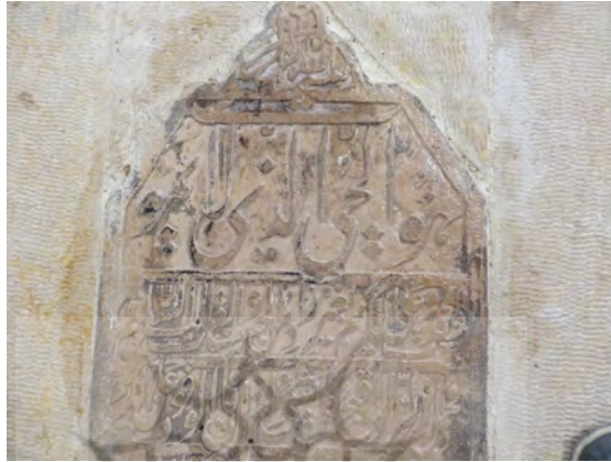
تصویر ۲۱: سنگ قبر آقا ملا محمد جعفر دوانی ثالث

پناه خلد جایگاه اعلم العلماء العاملين / الحاج حاجی عبدالصاحب دوانی فی شهر رجب المرجب سنه ۱۳۲۹.