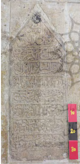
تصویر ۱۹: سنگ قبر حجة الاسلام شیخ غلامحسین وهبی

قمری در دوان است. ایشان مقدمات علوم را نزد پدر خود در دوان فرا گرفت و در محضر پدر و فضای روحانی حاکم بر آن زمان در دوان با علمای معاصر پدر محشور بود. آقا شیخ غلامحسین وهبی در تاریخ ۱۳۲۶ هجری قمری در دوان دار فانی را وداع گفت و در بقعه شیخ عالی به خاک سپرده شد (لهسایی زاده و ابراهیمی، ۱۳۹۲: ۳۰۶). مشخصات سنگ قبر: سنگ قبر مستطیلی شکل از جنس سنگ آهک و طرح محرابی در ابعاد ۳۳ × ۸۵ سانتیمتر که قسمت بالای آن به صورت مثلثی کار شده و بر روی سنگ کتیبه‌ای به خط نستعلیق در هشت سطر کنده کاری شده است (تصویر ۱۹).