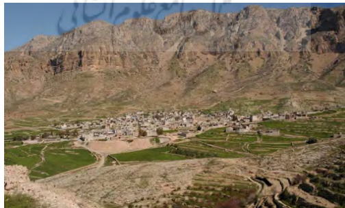
تصویر ۳: نمایی از روستای دوان