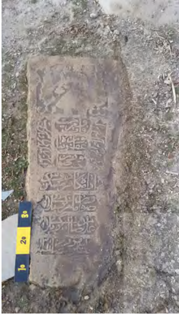
تصویر ۶: نمای یکی از سنگ قبرهای روستای دوان، حاوی مشخصات فرد متوفی و اشعاری در پیرامون آن

نگاره‌های سنگ قبور تاریخی روستای دوان را می‌توان به پنج گروه گیاهی، حیوانی، انسانی، نقوش انتزاعی و هندسی و اشیاء تقسیم‌بندی کرد. احتمالاً این تصاویر تحت تأثیر عقاید مذهبی، روایات و باورهای مردم روستا خلق شده‌اند و علاوه بر پر کردن فضای خالی قبور دارای جنبه زیبایی‌شناختی، آیینی و پیشینه تاریخی نیز بوده‌اند.