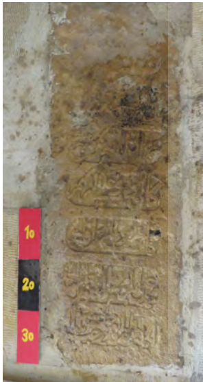
تصویر ۲۲: سنگ قبر آقا ملامحمد علی دوانی

متن روی سنگ قبر: ... [؟] القلب السليم / ... / ابو علی الله / وفات مرحوم المسرور آقا / محمد علی ابن المرحوم المغفور / الحاج محمد رجب المرجب ۱۳۳۳.