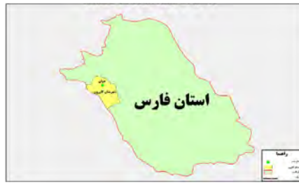
تصویر ۱: موقعیت جغرافیایی روستای دوان

و عرض جغرافیایی ۲۹ درجه و ۲۲/۵ دقیقه قرار گرفته است (لهسایی زاده و سلامی، ۱۳۷۰: ۱۶) (تصاویر ۱ تا ۳).