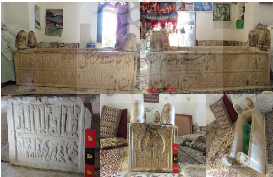
تصاویر ۱۱ تا ۱۵: سنگ قبر صندوقی شیخ علی بن احمد خطیب

بنا بر نظر شیخ الحکمایی، کلمه اربع مائه بر کتیبه نوشته نشده، اما بنا بر اطلاعاتی که از صاحب مقبره وجود دارد، تاریخ وفات وی را ۴۴۱ هجری قمری می‌داند. همچنین قطعه سنگی به ابعاد ۳۸ × ۹۴/۵ سانتیمتر بر سطح خارجی صندوق قرار دارد که روی آن با خط کوفی تزیینی و متفاوت با خط اصل کتیبه، سوره توحید نوشته شده است. با توجه به تفاوت خط این قطعه با اصل کتیبه، به نظر می‌رسد یا این قطعه مربوط به مقبره دیگری بوده و یا آن را در سال‌های بعد برای این مقبره ساخته‌اند (شیخ الحکمایی، ۱۳۶۷: ۶۳-۶۴؛ همو، ۱۳۷۲: ۹۵-۹۶) (تصاویر ۱۱ تا ۱۵).