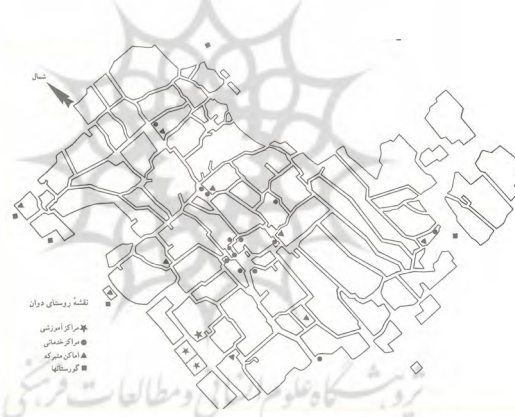
تصویر ۲: نقشه روستای دوان