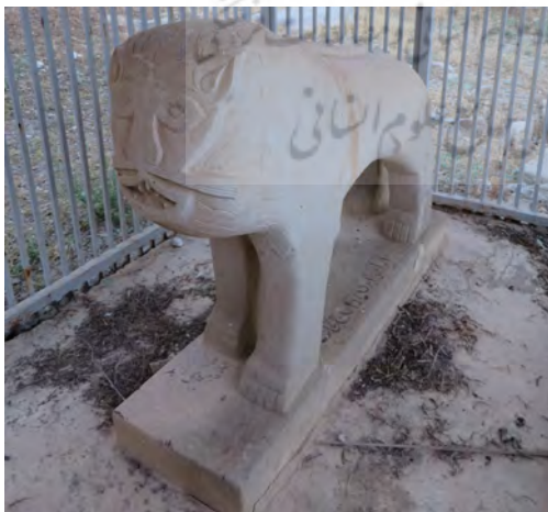
تصویر ۵: پیکره شیر سنگی بر سر

با توجه به فراوانی سنگ آهک در منطقه، سنگ قبرهای تاریخی روستای دوان غالباً از جنس سنگ آهک و دارای شکل‌های متنوع خوابیده (افقی)، ایستاده (عمودی)، محرابی، صندوقچه‌ای و یا در قالب شیرهای سنگی هستند (تصویر ۵). این آثار با کتیبه‌ها و نقش‌مایه‌های گوناگون به صورت گود، برجسته و ترکیبی تزیین شده‌اند. مضامین کتیبه‌ها غالباً شامل آیات قرآن، احادیث، اشعار، نام و نشان و تاریخ فوت متوفی است که با خطوط کوفی، نسخ، ثلث و نستعلیق نگارش یافته‌اند (تصویر ۶).