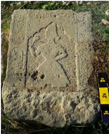
تصویر ۷: نقش انسان با گلی در دست

نقوش گیاهی روی سنگ قبرها غالباً شامل نقش درخت سرو و گل و بوته می‌شود. از دیگر نمونه‌های یافت شده، می‌توان به نقش گل در دست انسان اشاره کرد (تصویر ۷). نگاره حیوانات از دیگر نقوشی است که بر روی سنگ قبرها دیده می‌شود و نگاره‌های شیر، آهو، کبوتر و اسب از آن جمله‌اند.