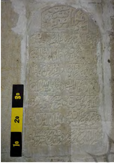
تصویر ۲۴: سنگ مزار آقا محمدباقر دوانی