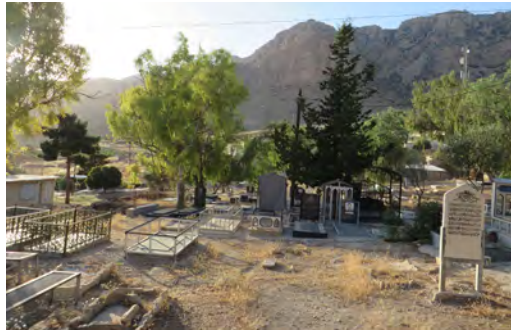
تصویر ۴: نمای یکی از گورستان‌های روستای دوان

از: بقعه شیخ عالی، امامزاده شاه سلیمان و حیات غیب.