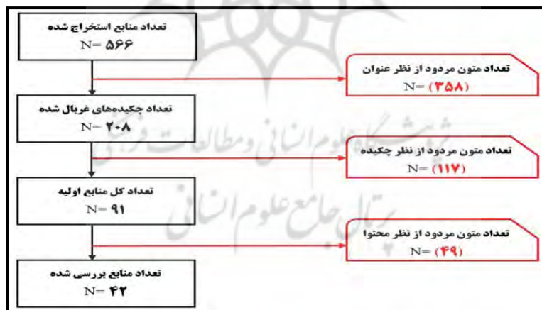
شکل (۱): فرآیند انتخاب منابع

تعداد ۵۶۶ منبع استحصال شد که در مراحل بعد پژوهشگر به بررسی آن‌ها پرداخته است. گام سوم به بررسی و جستجو در منابع و نهایتاً گزینش منابع مناسب و رد منابع نامربوط می‌پردازد که در این جا پژوهشگر موظف به بررسی چندین باره متون و غربال‌گری آن‌هاست که به شرح شکل (۱) انجام پذیرفته است.