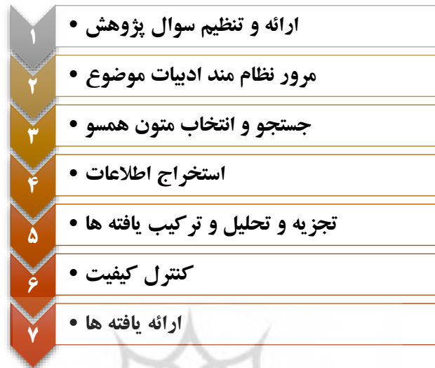
نمودار (۱): مراحل پژوهش در روش ساندلوسکی و باروسو

قرار داده است و برای بهره‌گیری از روش فراترکیب، از روش هفت مرحله‌ای ساندلوسکی و باروسو (۲۰۰۷) بهره گرفته شده است که خلاصه مراحل در نمودار (۱) نشان داده شده است.