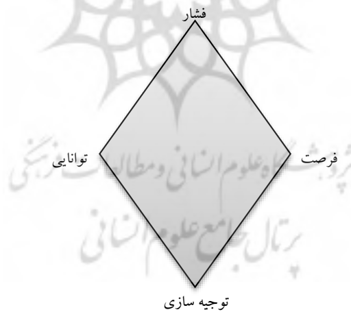
شکل (۲): مدل دیاموند تقلب (ولف و هرمانسون، ۲۰۰۴)

مدل دیاموند تقلب توسط ولف و هرمانسون (۲۰۰۴) مطرح شد. این مدل بعد توانایی ۱ را به عنوان عامل چهارم به مدل مثلث تقلب اضافه می‌کند. آن‌ها بر این عقیده هستند که داشتن توانایی‌های لازم برای انجام تقلب یکی از مهمترین عوامل ارتکاب تقلب می‌باشد. آن‌ها برای بعد توانایی عناصری را از قبیل توانایی شناسایی ضعف موجود در سیستم‌های حسابداری و کنترل‌های داخلی، توانایی استفاده از ضعف موجود در سیستم‌های حسابداری و کنترل‌های داخلی، اعتماد به داشتن توانایی برای جلوگیری از شناسایی شدن تقلب و توانایی وادار کردن دیگران به انجام تقلب را مطرح می‌کنند. سایر ابعاد این مدل، مشابه مدل مثلث تقلب می‌باشد. شکل (۲) این مدل را نشان می‌دهد.