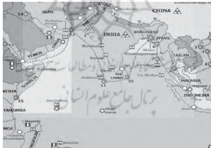
نقشه ۴. زنجیره مروارید چین و محاصره هند ۱

قدرت دریایی و حتی خطر تسخیر ارضی علیه هند باشد (Lintner, 2019). بی‌جهت نیست که هند زنجیره مروارید را تهدیدی سخت علیه امنیت ملی، سیاست منطقه‌ای و تمامیت سرزمینی خود می‌بیند (Times, 2018). به همین دلیل، زنجیره مروارید از مهم‌ترین مفاهیم در همه گزارش‌ها و سیاست‌های تجویزی یا توصیفی هندی از راه ابریشم چین است (Shrivastava, 2013). شگفتی‌انگیز نیست که بسیاری از مقامات هندی، نسبت به زنجیره مروارید واکنش نشان داده‌اند. فونچوک استوبدان، سفیر پیشین هند، چین و پاکستان را به دنباله‌روی از «نیت راهبردی برای محاصره هند» متهم کرد (Vajpeyi, 2011). دوباره در مه ۲۰۱۵ وزارت امور خارجه هند نسبت به دالان اقتصادی چین و پاکستان واکنش نشان داد (Misra, 2010). با وجود تأکید چینی‌ها بر نبود تهدید علیه هند (Peerzada, 2011)، مقامات هندی به واکنش علیه دالان و زنجیره ادامه داده‌اند. حتی مانیش تواری، رهبر حزب کنگره هند نیز، بر این مسئله تأکید کرد که اگر دالان چین و پاکستان امنیت ملی هند را تهدید کند، دهلی حق برخورد با آن را دارد (The Tribune, 2015). به بیان دیگر، مقامات هندی از جمله ژنرال چاترجی، سیاست خارجی چین را بخشی از راهبرد «برش سلامی» می‌بینند (Chatterji, 2020).