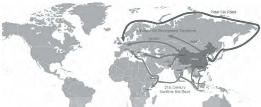
نقشه ۱. یک کمربند و یک راه ۱ : نویسنده

مسیر دریایی این کمربند کرانه‌های چین را از راه دریای چین جنوبی و اقیانوس هند به جنوب شرقی آسیا، اندونزی، هند، شبه‌جزیره عربستان، سومالی، مصر و اروپا پیوند می‌دهد و شامل دریای چین جنوبی، تنگه مالاکا، اقیانوس هند، خلیج بنگال، دریای عرب، دریای عمان، خلیج فارس و دریای سرخ است. این راه دریایی تلاشی است برای مدرن‌سازی، ارتقای زیرساخت‌ها و امکانات بندرها و مسیرهای لجستیکی از چین به جنوب شرقی و جنوب آسیا، خاورمیانه و شرق آفریقا. راه ابریشم دریایی دربردارنده بخش پرجمعیت و پرمصرفی از جهان خواهد بود. منطقه‌ای که مکان زندگی ۴۲ درصد از جمعیت جهان و ۲۵ درصد از تولید ناخالص داخلی آن، به‌استثنای چین است (Baker McKenzie, 2018). بی‌تردید در دهه‌های آینده در این بخش از جهان شرکت‌های چندملیتی از همه کشورهای، فرصت‌های شایان توجهی پیدا خواهد کرد.