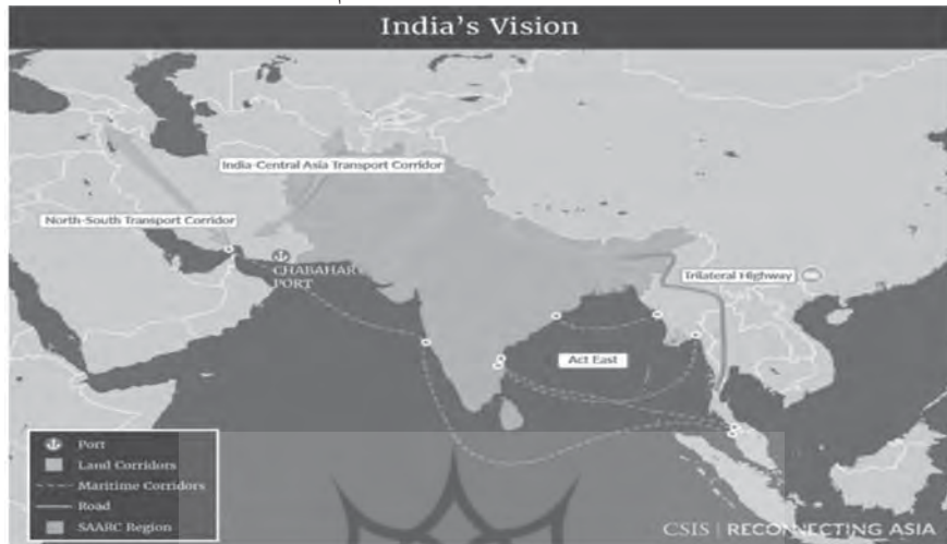
نقشه ۵. راهبرد کلان مائوسام ۱

در کنار این دو راه، دهلی سودای راه اندازی دو شاهراه بزرگ آسه آن در مسیر هند، میانمار و تایلند و راه بنگلادش، هند، بوتان و نپال را دارد. جزیره نیکوبار بزرگ از مهم ترین پایگاه های دریایی هند است که نظارت بر تنگه مالاکا را ممکن می کند (Brunner, 2013). همچنین حضور هند در دریای آندامان سبب مهار طرح چین برای دورزدن تنگه مالاکا از راه حضور در بندر کیاوک پیانو در میانمار و همچنین چیتاگونگ در بنگلادش می شود. هند احتمال گسترش بندر ترینکومالی در سریلانکا و گسترش نفوذ خود در جزایر سیشل و موریس را در نظر گرفته است. دهلی نو همچنین سودای گسترش روابط خود با جاکارتا را دارد. اندونزی، غول جنوب شرقی آسیا دارای بزرگ ترین اقتصاد آسه آن نیز به دنبال تعمیق پیوندهای خود با هند است. با توجه به اینکه بیشتر جمعیت این کشور در دو جزیره سوماترا و جاوا در اقیانوس هند جای گرفته اند، مهم ترین طرح ابتکار یک کمر بند و یک راه در بزرگ ترین اقتصاد جنوب شرقی آسیا راه آهن سریع السیر جاکارتا و باندونگ است. از این رو، هند می خواهد بی میلی گذشته خود را برای تعهد به توسعه محلی در این بخش از آسیای جنوب شرقی از میان بردارد.