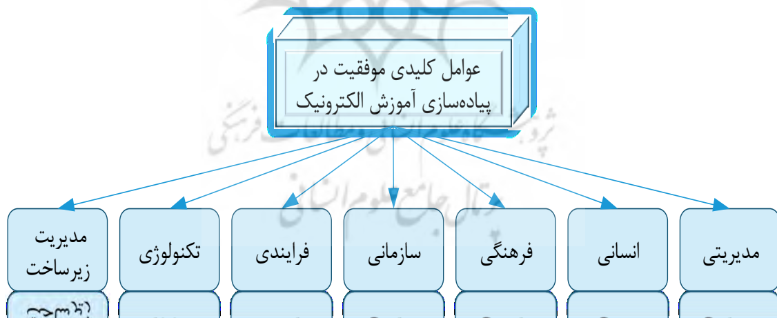
شکل ۱. ابعاد اصلی به عنوان عوامل کلیدی موفقیت در پیاده‌سازی آموزش الکترونیکی

بعد انسانی به عنوان سرمایه اصلی سازمان شناخته می‌شود. موفقیت یک سازمان در گرو در اختیار داشتن نیروی انسانی توانمند، پویا و متعهد است. در برخی از متون نیروی انسانی را به عنوان دارایی سازمان می‌شناسند که نقشی برجسته در موفقیت سازمان دارد چرا که افراد توانمند منشأ تحول هستند و می‌توانند فرآیند یادگیری الکترونیکی را متحول نمایند (رینتالا، ۲۰۲۰).