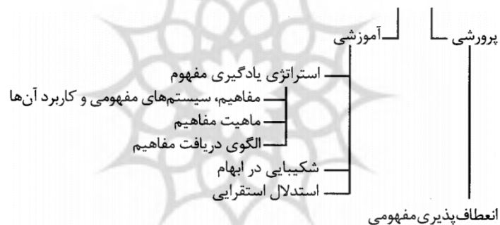
شکل ۲. نمودار آثار آموزشی و پرورشی روش دریافت مفهوم (بیگلر، ۱۳۹۰، ص ۷۷)

مطابق با طبقه‌بندی دیگر نیز معلمان سه گونه‌اند: توضیح‌دهنده، مشارکت‌دهنده و توانمندساز (افشارنیا، عباسی و دسترنج، ۱۳۹۷، ص ۷۵) که هر یک در موقعیت‌های مختلف می‌توانند منشأ آثار مختلف شوند. در شکل ۲ به برخی آثار دریافت مفاهیم و معانی ماحصل تدریس اشاره می‌شود.