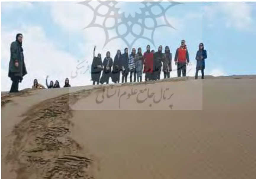
شکل ۵: تپه‌های ماسه‌ای دشت مختاران

باد با برداشت مواد و ماسه‌های ریز در سطح مخروطه‌افکنه‌های بهم‌پیوسته و انباشت دانه‌های درشت‌تر به‌ویژه ریگ‌ها باعث پیدایش دشت ریگی در دشت مختاران شده است.