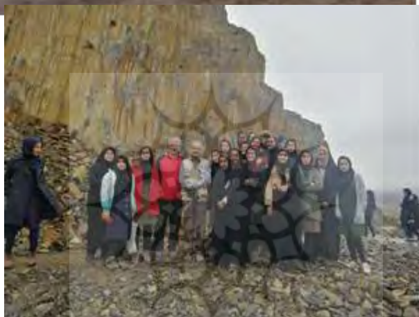
شکل ۴: دق اکبرآباد دشت مختاران و منشورهای بازالتی سربیشه