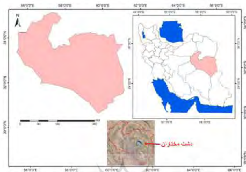
شکل ۱ دشت مختاران و موقعیت قرارگیری آن در استان خراسان جنوبی

دشت مختاران به علت قرار گرفتن در مجاورت بیابان لوت دارای آب‌وهوای خشک و سرد می‌باشد. اختلاف درجه حرارت در طول شبانه‌روز در فصول مختلف سال زیاد بوده آگاهی به ۵۰ درجه سانتی‌گراد می‌رسد و حداکثر مطلق آن ۴۴ درجه سانتی‌گراد، حداقل مطلق آن ۲۱/۵- درجه سانتی‌گراد و میانگین دمای سالانه ۱۴/۱۶ درجه سانتی‌گراد ثبت شده است (رئیس‌السادات و معتمدالشریعتی، ۱۳۹۸). منطقه مورد مطالعه از سه واحد ژئومورفولوژی تشکیل گردیده است که عبارت‌اند از: واحد کوهستان، واحد دشت‌سر و واحد پلایا یا چاله داخلی تقسیم می‌شود. ارتفاعات غالباً دارای روند شمال غرب - جنوب شرقی و شرقی- غربی می‌باشند. با توجه به نقشه‌ی توپوگرافی ترسیم‌شده دشت مختاران، بلندترین نقطه این ناحیه در ارتفاعات رشته‌کوه باقران با ارتفاع ۲۶۴۶ متر در شمال دشت مختاران و پست‌ترین نقطه دارای ارتفاع ۱۲۸۵ متر از سطح دریاهای آزاد در مرکز دشت می‌باشد (شکل ۲).