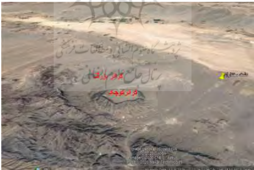
شکل ۶: کراتر آغل کوه در جنوب دشت مختاران و دق اکبرآباد

در حاشیه کفه و در قسمت مرکزی آن مجموعه سنگ‌های آذرین مشاهده می‌شود. مجموعه‌های آذرین از نظر سنی بیشتر متعلق به پالئوژن می‌باشند که بیشتر در جنوب کفه مختاران گسترش دارند. این مجموعه از نظر سنگ‌شناسی شامل میکرودیوریت، آندزیت بازال، داسیت و انواع توف می‌باشد. در بین این مجموعه سنگی دو ساختار زیبا در منطقه دیده می‌شود. یکی از این ساختارها به نام آغل گیوشاد شناخته می‌شود. آغل گیوشاد دارای ساختمانی مدور است و ترکیب سنگ‌شناسی آن میکرودیوریت می‌باشد که نزدیکی روستای گیوشاد قرار دارد. ساختار مشابه دیگری نیز در جنوب روستای هردنگ در جنوب کفه نیز مشاهده می‌شود که به نام آغل کوه مشهور است (شکل ۶). بنابر مطالعات انجام‌شده (Master et al., 2014, Khatib and zarrin koup, 2009) این ساختار ناشی از فروریزش یک قله آتشفشانی است. فرونشستن و ریزش فوقانی مخروط آتشفشان باعث ایجاد این نوع کراتر می‌گردد. به عبارت دیگر یک کراتر کوچک در داخل یک کراتر بزرگ‌تر قرار گرفته است. هر دو ساختار از پدیده‌های ژئوتوریسم جالب و منحصر به فرد در خراسان جنوبی محسوب می‌شوند.