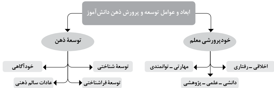
شکل ۱. ابعاد و عوامل نقش معلم در توسعه و پرورش ذهن