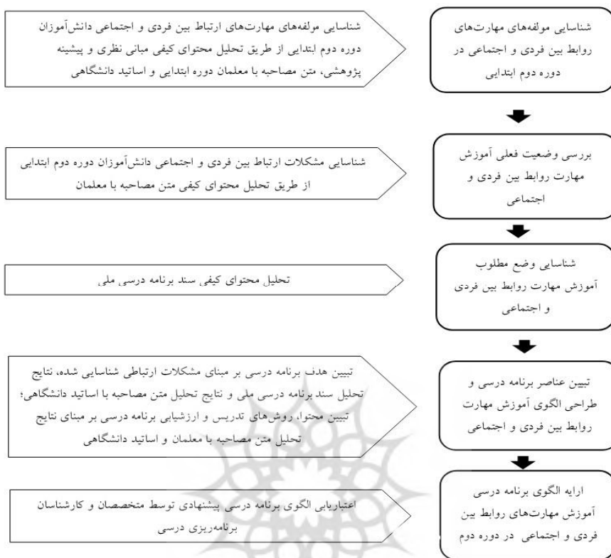
شکل ۱. مراحل پژوهشی و منابع کسب اطلاعات

برای شناسایی مولفه‌های مهارت ارتباطی بین فردی و اجتماعی و نیز شناسایی مشکلات ارتباطی دانش‌آموزان، با معلمان دوره دوم ابتدایی، مصاحبه به عمل آمد. معلمان یکی از نزدیک‌ترین و بهترین اشخاص برای مشاهده رفتارهای اجتماعی دانش‌آموزان در موقعیت‌های مختلف هستند. برای دسترسی به معلمان و کسب اطلاعات از آنها، از روش نمونه‌گیری در دسترس، هدفمند و نظری استفاده شد. به طوری که معلمان دوره دوم ابتدایی که دارای سطح کارشناسی ارشد یا دکتری، فارغ‌التحصیل هر یک از رشته‌های روان‌شناسی و علوم تربیتی و دارای سابقه تدریس بیشتری بودند از طریق اداره آموزش و پرورش مناطق ۱۵، ۱۶ و ۱۹ شهر تهران شناسایی شدند و مصاحبه با آنها تا آنجا صورت گرفت که نمونه بعدی، اطلاعات جدید دیگری در اختیار مصاحبه‌گر قرار ندهد. در مجموع ۲۰ معلم مورد مصاحبه قرار گرفتند. کلیه