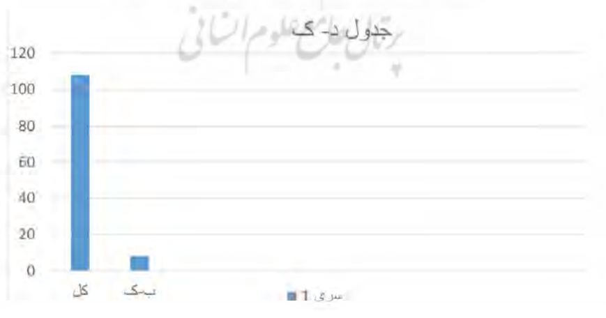
جدول تعداد خطا نسبت به کل - شماره ۵ زبانی