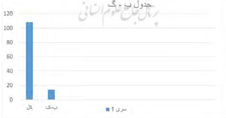
جدول تعداد خطا نسبت به کل - شماره ۳