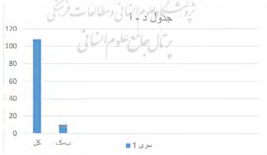
جدول تعداد خطا نسبت به کل - شماره ۶