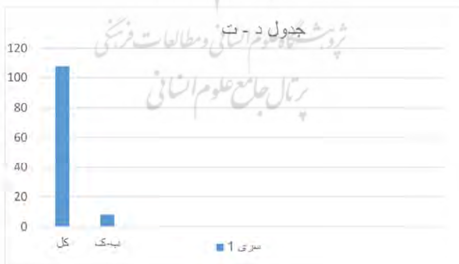
جدول تعداد خطا نسبت به کل - شماره ۸