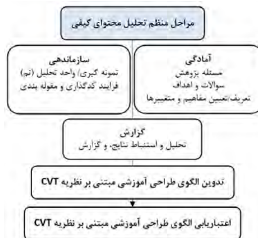
تصویر ۱. مراحل تحلیل محتوای کیفی استقرایی

مجله روان‌پزشکی و روان‌شناسی بالین ایران