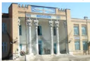
تصویر شماره ۵: دبیرستان انوشیروان دادگر، نیکولای مارکوف، تلفیق معماری مدرن و معماری باستانی ایرانی

در پروژه دبیرستان انوشیروان دادگر، وی تلاش کرده است که سمبل‌های معماری باستانی ایران را در طرح‌ها استفاده کند و ملی‌گرایی در این بنا بیشتر دیده می‌شود ولی همانند پروژه‌های دیگر در این پروژه نیز وی تلاش کرده است که ترکیب سنت و مدرنیته را در کنار یکدیگر مدیریت کند استفاده از تناسبات خاص، ستون‌های ورودی بنا، نقوش و تزئینات معماری قبل از اسلام و نیز ترکیب مصالح و رنگ‌های سنتی با انواع امروزی آن از دیگر ویژگی‌های معماری این بنا محسوب می‌شوند. در حقیقت در این بنا شاهد حفظ ویژگی‌های ظاهری و معنوی معماری سنتی ایران هستیم و همزمان امروزی بودن نیز در بنا حس می‌شود (تصویر شماره ۵).