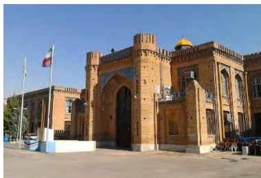
تصویر شماره ۱: تفکر مدرن و مصالح و فن آوری سنتی در طراحی دبیرستان البرز، تهران - نیکولای مارکوف

کاشی و دیوارهای باربر در کنار یکدیگر است (تصویر شماره ۱).