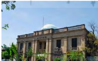
تصویر شماره ۴: ساختمان سینگر، نیکولای مارکوف

با کاربرد ویژگی‌های معماری اسلامی و صفوی، نیکولای مارکوف توانست ساختمان‌هایی را طراحی کند که دارای شخصیت مستقل بودند. وی بناهای دیگری چون دبیرستان انوشیروان دادگر، مجموعه ورزشی امجدیه (شهید شیروودی)، کارخانه قند ورامین و چندین بنای دیگر را طراحی کرد. در بنای «ساختمان سینگر» که یکی دیگر از ساختمان‌های طراحی شده توسط وی است، المان‌های تاریخی اروپایی را می‌توان مشاهده کرد. این بنا را می‌توان در رده‌بندی سبک آرت دکو بین‌الملل قرار داد و می‌توان آن را در هر جای دنیا به‌عنوان نمادی از این سبک بین‌المللی شناخت (صفامنش، ۱۳۹۰: ۲۱). وقار، تناسب، تعادل، توازن، تکرار، ریتم و هندسه از ویژگی‌های مهم معماری مارکوف محسوب می‌شوند در این بنا نیز انتخاب مصالح و تناسبات معماری نما و پلان مجموعه براساس کاربری بنا و نیز همسایگی و همجواری با سایت این پروژه تعریف شده‌اند که نشانگر ارتباط این بنا با فضای بیرون خود است (تصویر شماره ۴).