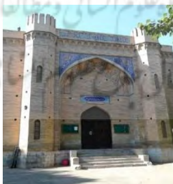
تصویر شماره ۲: معماری صفوی اسلامی و معماری مدرن غرب

نیکولای مارکوف از جمله معمارانی بود که توانست در کاربرد و مدیریت ترکیب هارمونی و تناسب معماری صفوی با معماری باستانی و نیازهای یک طراحی مدرن ارتباط خوبی در معماری برقرار سازد. از نظر فرم، حجم بنا و ترکیب بندی عناصر معماری با عناصر جدیدی روبرویم و در عین حال شاهد به کارگیری تزئینات، طاق های ایرانی و مصالح سنتی در بنای ساختمان هستیم. علاقه وی به ایران و معماری ایرانی و هم چنین تمایلش به معماری آرت دکو و ارتباط آن با جریان های بین المللی غرب باعث رشد و توسعه سبک وی در معماری ایران شد (تصویر شماره ۲).