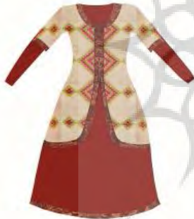
تصویر شماره 5

انتخاب پارچه، رنگ و تزئین‌های مربوط به طرح مانتو