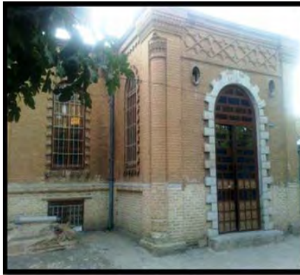
بانک غیرفعال در سرای نو در بازار سنتی کرمانشاه (میرزایی، ۱۳۹۰) راسته بازار کرمانشاه (میرزایی، ۱۳۹۰)