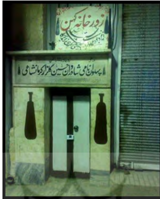
زورخانه گلزار کرمانشاهی در راسته بازار کرمانشاه (میرزایی، ۱۳۹۰)

به این پیشینه نه سقوط به ورطه کهنگی که اعتماد و تکیه است به استواری بنیان‌های ریشه‌دار کهن. بازارها اگر برای ما کالبدی فرسوده دارند و کالبد و راسته‌هایش ضعیف هستند ولی نشان‌دهنده تاریخ ماست که آرام‌آرام جلو رفته و فرهنگ، هویت و معنا یافته است. ما باید روح بازار را حفظ کنیم و کالبدش را تقویت کنیم و رابطه‌اش را با بافت مجاور برقرار کنیم. برای روشن شدن ابعاد معنای مکان در راه رسیدن به هویت، به بررسی موضوعی بازار سنتی کرمانشاه به عنوان مکانی با هویت ملی ایرانی و واجد معنا پرداخته شده است. به این منظور بازار به عنوان کل و مکان‌های تأثیرگذار به عنوان جزء در نظر گرفته شده‌اند تا بدین وسیله میزان اثرگذاری مکان بر مخاطب و عواملی که خاطره و تصویر ذهنی را می‌سازند، مشخص شود. مکان جزء (تأثیرگذار) عبارتند از: