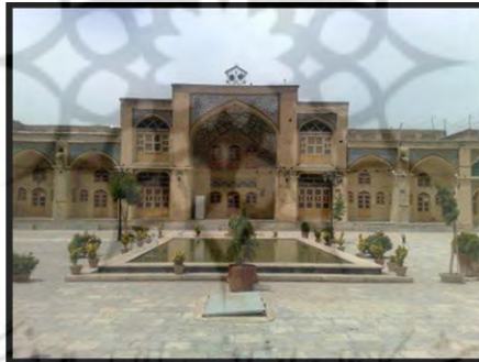
مسجد عمادالدوله در بازار کرمانشاه (میرزایی، ۱۳۹۰)