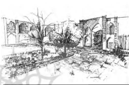
راسته بازار کرمانشاه