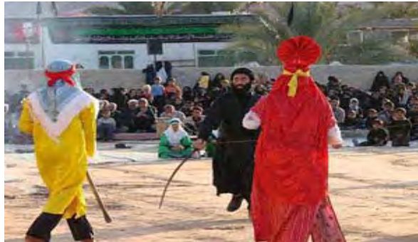
شکل شماره ۱: تعزیه در استان بوشهر

گفتنی است که ایران شاید تنها کشوری در میان مسلمانان باشد که هنر نمایش را به تعالی رساند. به گونه‌ای که مراسم تعزیه شکل تکامل یافته آیین‌ها و مراسم سوگواری هم چون دسته‌گردانی، نوحه‌سرایی، نقالی و روضه‌خوانی می‌باشد.