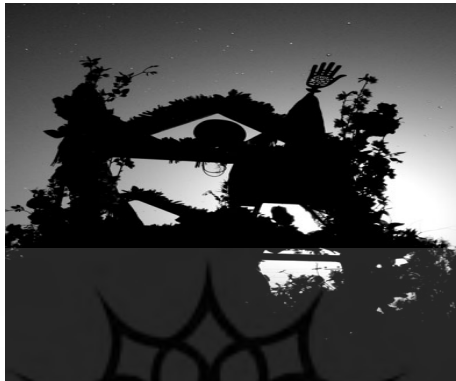
شکل شماره ۵: مراسم علم‌گردانی در منطقه بوشهر

مختک و تُویت (گهواره علی‌اصغر) مراسم دیگری است که در منطقه بوشهر اجرا می‌شود. بدین صورت که در روز عاشورا گهواره‌ای چوبی می‌سازند و پس از قراردادن طفلی در آن (در گذشته عروسک و امروزه از طفل صغیر و نوزاد استفاده می‌کنند)، آن را در منازل می‌چرخانند؛ به طوری که به صاحب مختک و کسی که گهواره را می‌چرخاند پولی داده می‌شود و مردم نیز برای افزایش طول عمر بچه‌های خود نذر می‌کنند و وجه نقدی به صاحب مختک می‌پردازند. گفتنی است زنان نیز گاه برای حفظ سلامتی خود و خانواده‌شان از زیر گهواره رد می‌شوند. اگرچه در منطقه زابل هیچ یک از این رسوم در برگزاری آیین گهواره علی‌اصغر اجرا نمی‌شود. لازم به ذکر است در روز عاشورا پس از پایان مراسم عاشورا، مراسم شبیه اصغر را اجرا می‌کنند. ولی امروزه