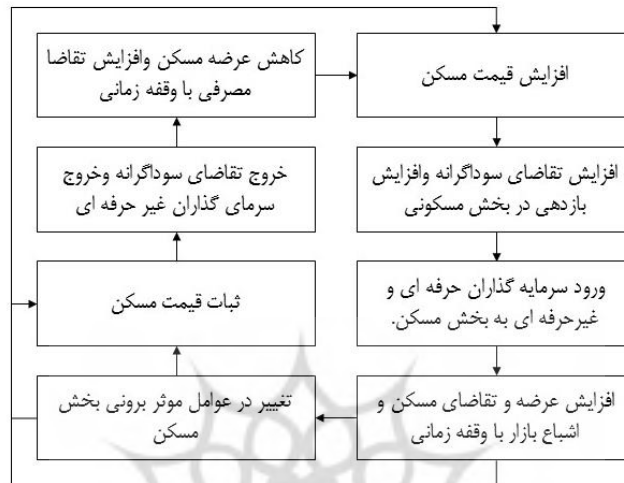
نمودار ۲. عوامل اصلی رونق و رکود اقتصادی مسکن معاصر شهر تهران طی سال های ۱۳۹۵ تا ۱۳۹۹

می‌گردد. بر این اساس در شکل گرفتن دوره‌های رونق و رکود در بازار مسکن مطلب قابل تعقل این می‌باشد که در شکل گرفتن این دوره‌ها، افزون بر عامل‌های درون حوزه ای بازار مسکن (همچون دوره ساخت مدید، کمبود عرضه، ورود و خروج سازندگان غیرحرفه ای و...)، عوامل برون بخشی (از جمله توانایی خرید خانوار، چگونگی تولید ناخالص داخلی، نقدینگی، تورم کلی، نرخ بهره، بودجه دولت و...) نیز موثر هستند.