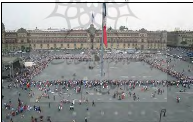
تصویر ۲- میدان زوکالو، مکزیکوسیتی

این مقاله به دنبال پاسخ به این سؤالات است: