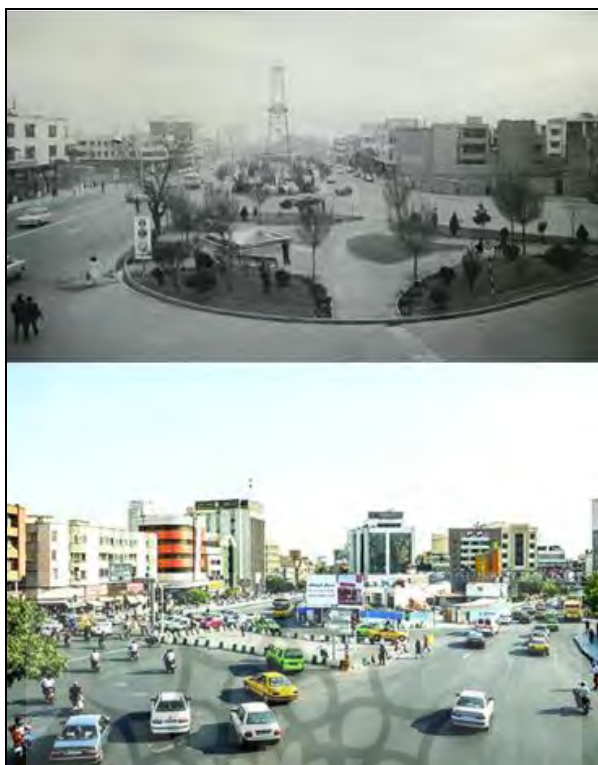
تصویر ۱- تغییر هویت از میدان به فلکه‌ای برای تردد اتومبیل‌ها