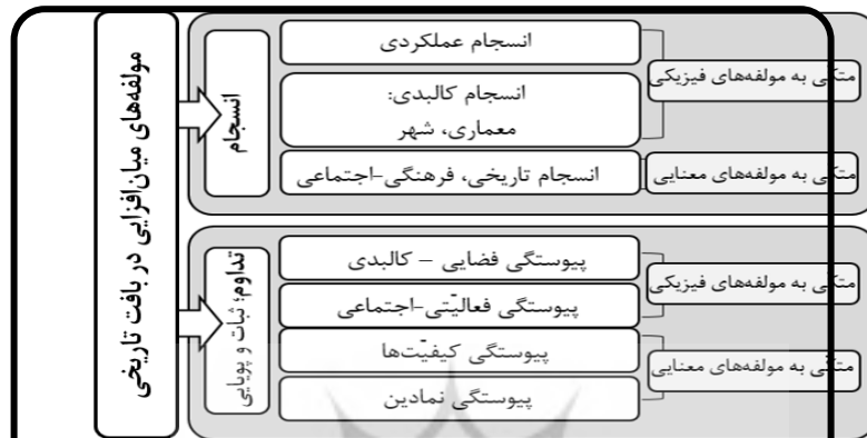
نمودار (۱)- معیارهای کیفی میان‌افزایی در بافت تاریخی، منبع: یافته‌های پژوهش، ۱۳۹۹

این نمودار با افزودن عوامل موثر بر هر یک از این ابعاد تدقیق شده و نمودار ۲، را به عنوان الگوی تدقیق شده و قابل سنجش ارائه می‌دهد. در نمودار ۲، مولفه‌های میان‌افزایی در بافت تاریخی در دو گروه مولفه‌های فیزیکی (ابعاد کالبدی-محیطی و عملکردی) و مولفه‌های معنایی (ابعاد تاریخی، فرهنگی-اجتماعی) دسته‌بندی شده و در زیر هر بُعد عوامل موثره آمده است.