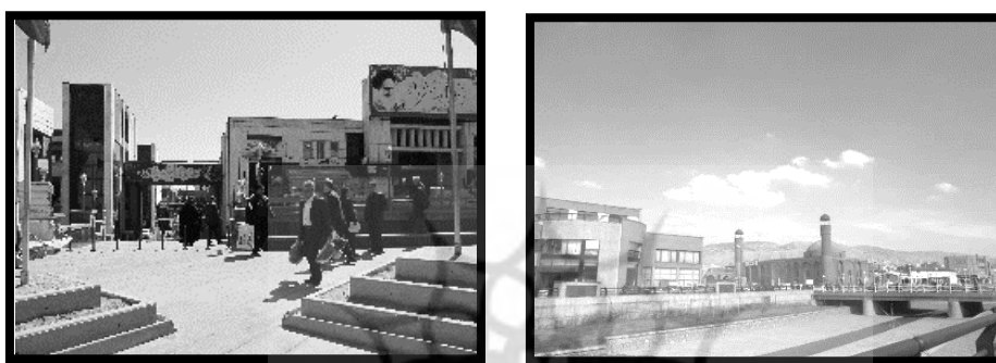
تصویر (۱) و (۲) - مجموعه‌ی تجاری صاحب‌الامر (راست) مجموعه‌ی تجاری مشروطه (چپ)، منبع: یافته‌های پژوهش، ۱۳۹۹

بازار تاریخی تبریز با پیوستگی کالبدی از حاشیه‌ی خیابان جمهوری اسلامی تا حاشیه‌ی شمالی چای‌کنار قرار دارد. که در سده‌ی نهم تا دوازدهم نیز علاوه بر گسترش فضای تجاری آن، کاربری‌های مذهبی و حکومتی نیز در کنار آن ساخته شدند. در میان تمامی ساختارهای جدید افزوده شده به این بافت، ثبات مختصات مکانی و همگن بودن افشار، به علاوه مشابه بودن کاربری و خدمات‌رسانی به عموم مردم در ساعات مختلف شبانه‌روز موجب شد تا دو مجموعه‌ی تجاری مشروطه و صاحب‌الامر به عنوان نمونه‌های موردی انتخاب شوند (نقشه ۳، تصاویر ۱ و ۲). این دو مجموعه همچنین به دلیل مقیاس بزرگ پروژه تأثیر قابل توجهی بر ارزیابی مخاطبان دارند و هم‌جواری محسوس با بافت تاریخی، امکان بهتری برای مطالعه پیرامون میان‌افزایی در ارتباط با محیط تاریخی اطراف را فراهم می‌کند.