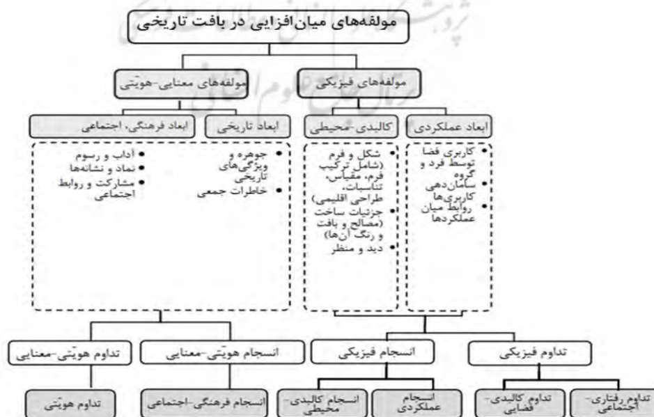
نمودار (۲)- مولفه‌های موثر بر معیارهای کیفی میان‌افزایی در بافت تاریخی

این عوامل نیز به نوبه خود بر دستمایه مولفه‌های کیفی میان‌افزایی در بافت تاریخی (انسجام و تداوم) اثرگذارند. عوامل وابسته به ابعاد کالبدی-محیطی و عملکردی بر انسجام و تداوم فیزیکی (انسجام کالبدی-محیطی، انسجام عملکردی، تداوم فضایی-کالبدی، تداوم فعالیتی-اجتماعی) موثرند. عوامل وابسته به ابعاد تاریخی-فرهنگی-اجتماعی نیز، بر شکل‌گیری انسجام و تداوم معنایی (انسجام تاریخی، فرهنگی-اجتماعی، تداوم کیفیت‌ها و تداوم نمادین) اثر می‌گذارند. بنابراین، جهت سنجش هر یک از گونه‌های انسجام و تداوم، نیاز است ارزیابی افراد را از تغییر در هر یک از عوامل موثر بر ابعاد و مولفه‌ها بعد از میان‌افزایی در بافت تاریخی را استخراج کرد.