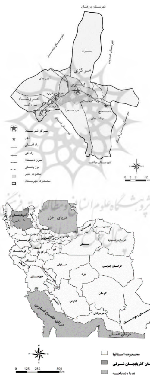
نقشه (۱) و (۲) - موقعیت استان آ.ش. در نقشه سیاسی ایران (راست) و نقشه‌ی شهرستان تبریز (چپ)، منبع: سالنامه آماری استان آذربایجان شرقی؛ ۱۳۹۵: ۵۲ و

تبریز یکی از مهم‌ترین شهرهای تاریخی ایران است که موقعیت آن در ارتباط با راه‌های تجاری از گذشته تا حال، همواره، منجر به توسعه‌ی کالبدی و فرهنگی‌اش شده است (نقشه ۱ و ۲). به‌علاوه، جمعیت رو به رشد آن، نیز، الزام توسعه در بافت‌های تاریخی آن را ایجاد کرده‌است. این شرایط به مرور زمان، این شهر را به یک مرکز مهم از نظر فرهنگی، سیاسی و اقتصادی در منطقه‌ی شمال‌غرب کشور تبدیل کرده است که در این میان بازار تاریخی تبریز نقش مهمی دارد.