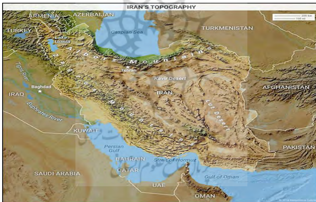
نقشه ۱: مرزهای ایران

خط مرزی ایران ۳ هزار و ۶۶۲ مایل است. از میان این کشورها ترکمنستان طولانی‌ترین مرز مشترک با ایران را دارد. طول خط مرزی میان ایران و ترکمنستان حدود ۷۱۳ مایل است. کوتاه‌ترین مرز مشترک با ایران هم به کشور ارمنستان تعلق دارد که حدود ۲۷ مایل می‌باشد. ایران بیش از ۶۰۰۰ کیلومتر با کشورهای افغانستان، پاکستان، ترکمنستان، ترکیه، ارمنستان، جمهوری آذربایجان و عراق مرز مشترک (خشکی) دارد (امیراحمدیان و همکاران، ۱۳۹۵). ایران همچنین دارای ۲۷۰۰ کیلومتر مرز آبی در دریای خزر، خلیج فارس و دریای عمان است. ایران طولانی‌ترین مرز را با عراق و کوتاه‌ترین مرز را با ارمنستان دارد. از ۳۱ استان ایران، ۱۶ استان مرزی هستند که از میان آن‌ها، نه استان تنها مرز زمینی دارند (اردبیل، آذربایجان شرقی، آذربایجان غربی، کرمانشاه، کردستان، ایلام، خراسان شمالی، خراسان رضوی و خراسان جنوبی) ۳ تای آن‌ها فقط از راه دریا مرز دارند (مازندران، هرمزگان و بوشهر) و ۴ تا از استان‌ها هم هر دو مرز زمینی و دریایی را دارا است (گیلان، گلستان، سیستان و بلوچستان و خوزستان) (رحیمی، ۱۳۹۳).