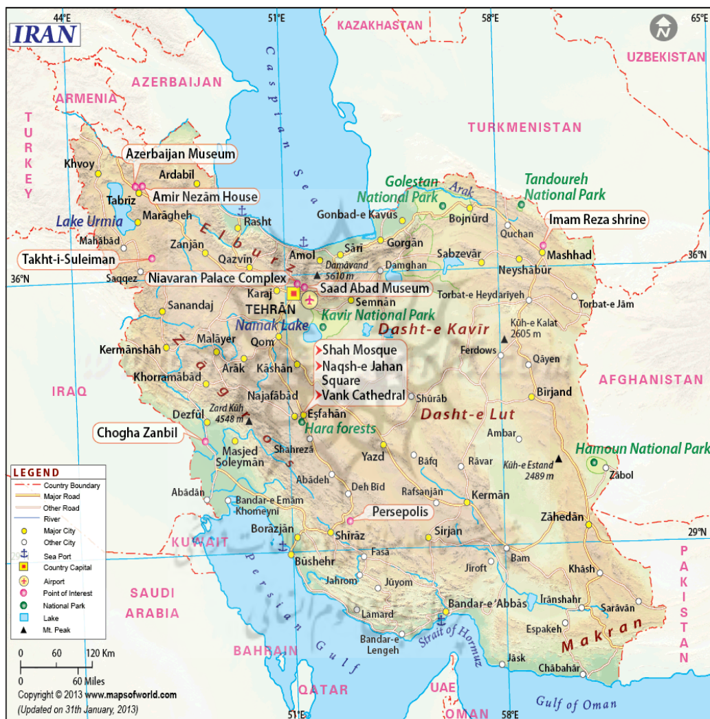
نقشه ۲: جغرافیای سیاسی ایران در مرزها

استان‌های گلستان، خراسان شمالی و خراسان رضوی با جمهوری ترکمنستان مرز اشتراکی دارند.