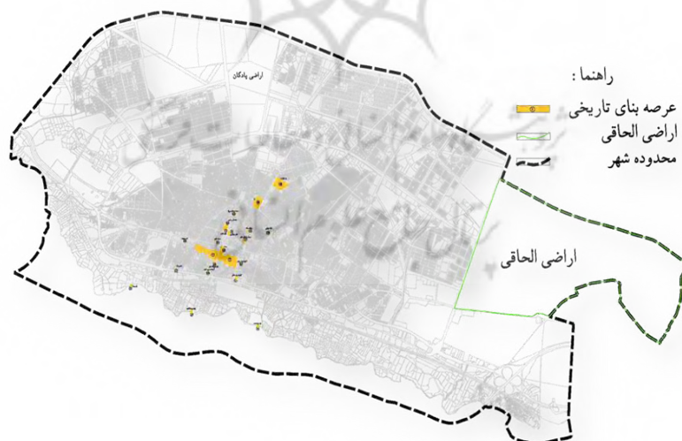
شکل (۲): توزیع فضایی جاذبه‌های گردشگری در بافت تاریخی (مهندسین مشاور آرمان شهر، ۱۳۸۸)

روش پژوهش حاضر از نظر روش توصیفی-تحلیلی و از نوع کاربردی است. روش گردآوری اطلاعات به صورت کتابخانه‌ای و میدانی است، پرسشنامه حاوی ۸ شاخص اجتماعی: امنیت، مشارکت، حس تعلق، تعاملات اجتماعی، خاطره‌انگیزی، آگاهی، وابستگی به مکان، انسجام و همبستگی و در ۴۰ گویه را نشان می‌دهد. جهت تجزیه و تحلیل