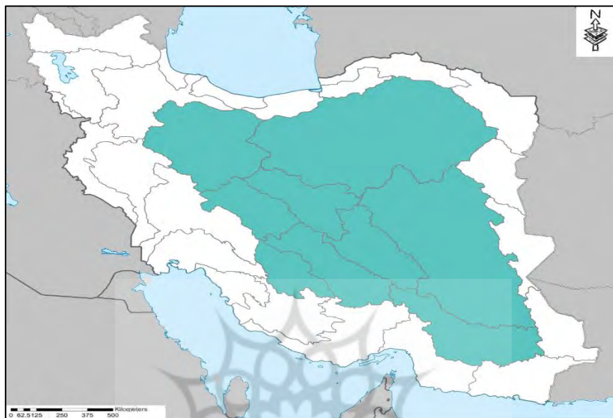
نقشه ۱: محدوده فلات مرکزی ایران

محدوده‌ی این پژوهش انواع مدل‌های معماری مناطق جغرافیایی-اقليمی ایران است. در مناطق فلات مرکزی ایران آب و هوا گرم و خشک می‌باشد.