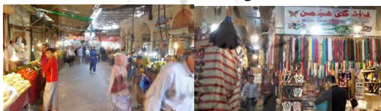
شکل ۴- بازار سلیمانیه (نگارندگان) شکل ۵- بازار سلیمانیه (نگارندگان)