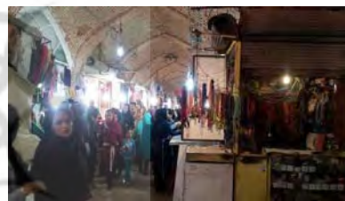
شکل ۲- بازار سندج (نگارندگان) شکل ۳- بازار آصف (نگارندگان)