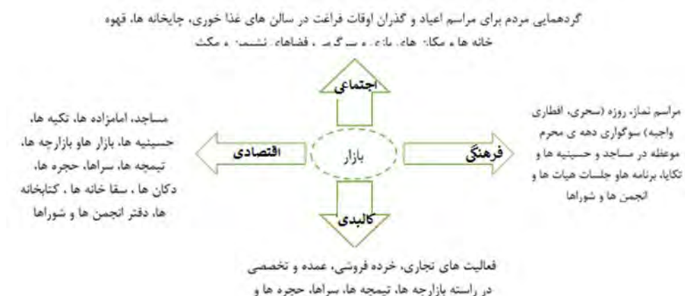
شکل ۱- اهمیت بازار به لحاظ اقتصادی، اجتماعی، کالبدی، مذهبی و فرهنگی