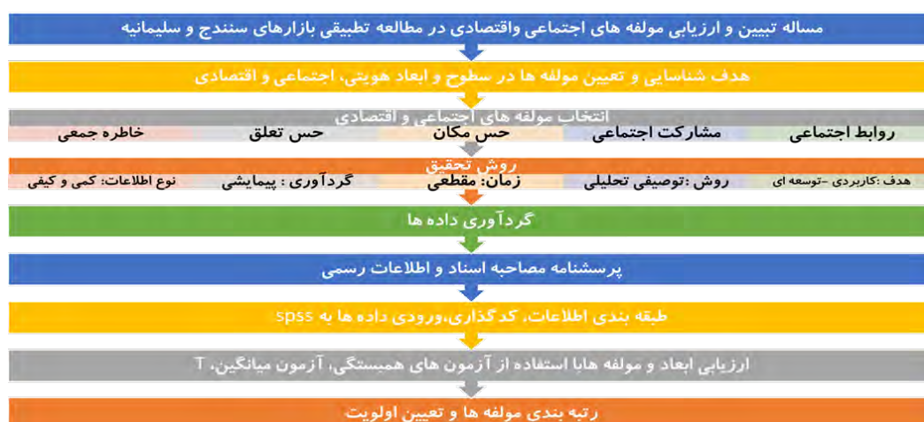
شکل ۸- شمای مراحل تحقیق