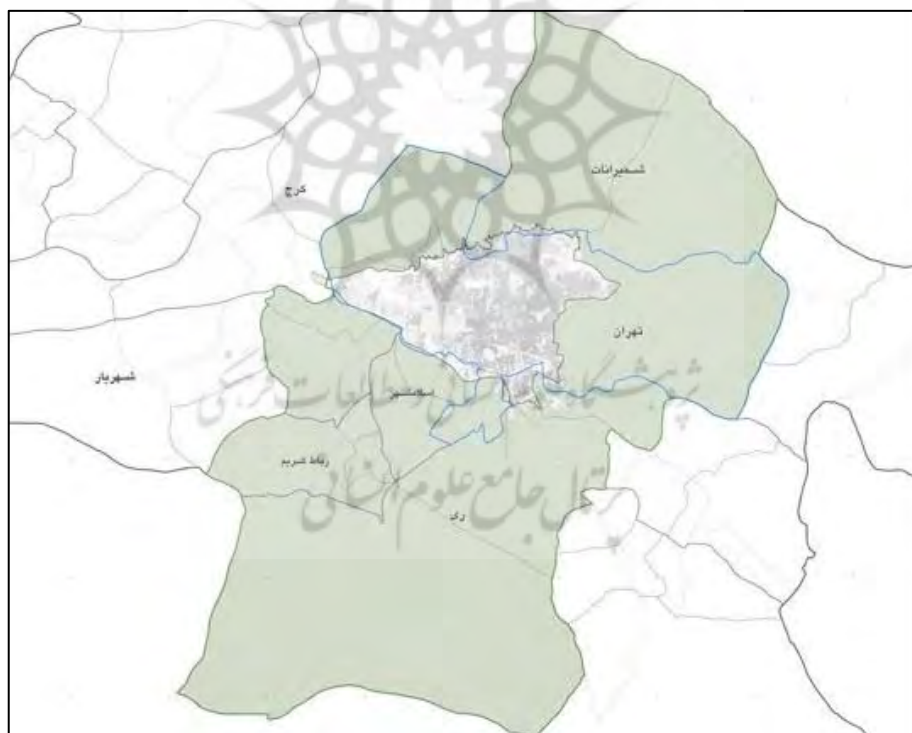
نقشه ۱: حریم شهر تهران

حریم پایتخت عرصه‌ای است به وسعت تقریبی ۵۹۱۸ کیلومترمربع شامل شهرستان‌های کنونی تهران، ری، شمیرانات، اسلامشهر و رباط کریم و بخش‌های قدس و مرکزی از شهرستان شهریار به استثنای دهستان جوقین که در محدوده شمالی از منتهی‌الیه شمال شرق به سمت شمال غرب، منطبق است بر حد شمالی شهرستان شمیرانات، از منتهی‌الیه شمال غرب به جنوب غرب، به ترتیب منطبق است بر حد غربی شهرستان شمیرانات، حد شمال غربی و غربی شهرستان تهران، حد شمال غربی و غربی بخش قدس، حد غربی بخش مرکزی و حد شرقی دهستان جوقین از شهرستان شهریار، حد شمال غربی و جنوب غربی شهرستان رباط کریم و حد غربی شهرستان ری، از منتهی‌الیه جنوب غرب به جنوب شرق، منطبق است بر حد جنوبی شهرستان ری و بالاخره از منتهی‌الیه جنوب شرق به شمال شرق به ترتیب منطبق است بر حد شرقی شهرستان ری، حد جنوب شرقی و شرقی شهرستان تهران و حد شرقی شهرستان شمیرانات.