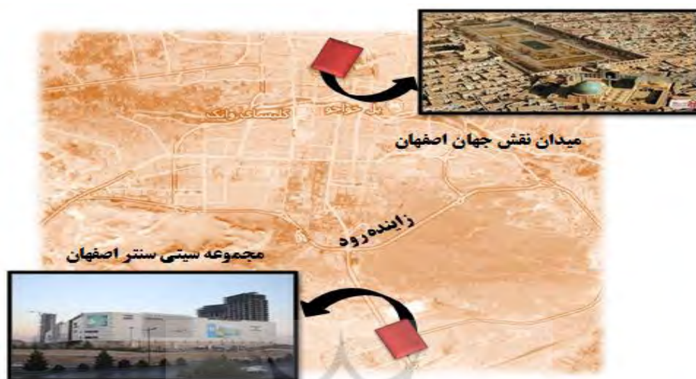
نقشه شماره ۱: موقعیت دو نمونه مورد مطالعه میدان نقش جهان و مجموعه سیتی سنتر اصفهان؛ منبع: نگارندگان

امام در جنوب میدان، مسجد شیخ لطف الله در شرق، کاخ عالی قاپو در غرب و سر در قیصریه در شمال قرار دارند که هر یک در نوع خود شاهکاری بی بدیل می‌باشند. این میدان در طول حیات خود کاربری‌های متنوعی را بر عهده داشته که از جمله می‌توان به عملکرد سیاسی