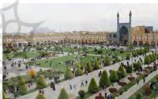
تصویر شماره ۱: میدان نقش جهان اصفهان؛ منبع: نگارندگان تصویر شماره ۲: سیتی سنتر اصفهان؛ منبع: نگارندگان