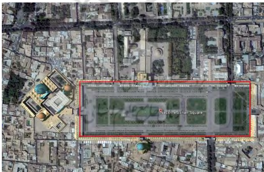
نقشه شماره ۲: موقعیت میدان نقش جهان اصفهان

به لحاظ استقرار کاخ سلطنتی، عملکرد مذهبی به لحاظ استقرار دو مسجد، عملکرد تجاری به لحاظ وجود حجره‌ها و قرارگیری در بطن بازار و عملکرد تفریحی بدلیل برگزاری جشنها و اعیاد ملی اشاره نمود.