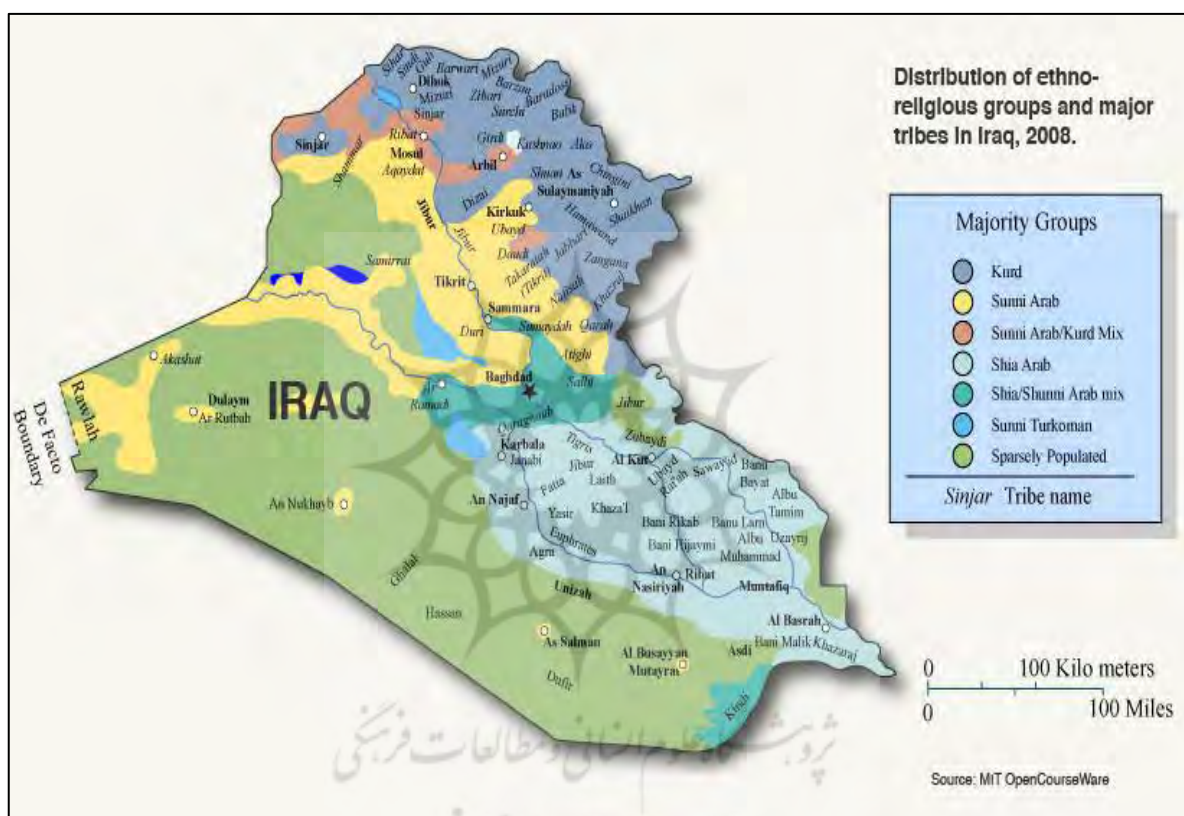
نقشه ۲: تقسیمات سیاسی عراق

پارلمانی و یک انتخابات همه پرسی قانون اساسی، نظام سیاسی جدید عراق شکل گرفت. بر اساس قانون اساسی دائمی جدید عراق، این کشور دارای نظام جمهوری دموکراتیک فدرال است و نظام حکومتی آن پارلمانی است. اعضای پارلمان به واسطه انتخابات به صورت مستقیم از سوی مردم تعیین می‌شوند و پارلمان نیز شورای ریاست جمهوری، متشکل از رئیس جمهور و دو معاونش را انتخاب می‌کند. رئیس جمهور نیز نخست وزیر را مسئول تشکیل کابینه می‌کند. به دلیل تنوع قومی و مذهبی و مشارکت نمایندگان تمام گروه‌ها در پارلمان، پست‌های سیاسی حکومت و هیات دولت بین احزاب و گروه‌های مختلف طبق میزان نمایندگان آن‌ها تقسیم می‌شود. در حال حاضر نخست وزیر شیعه، رئیس جمهور کرد و رئیس مجلس در عراق سنی مذهب است (بیکی، ۱۳۸۹).