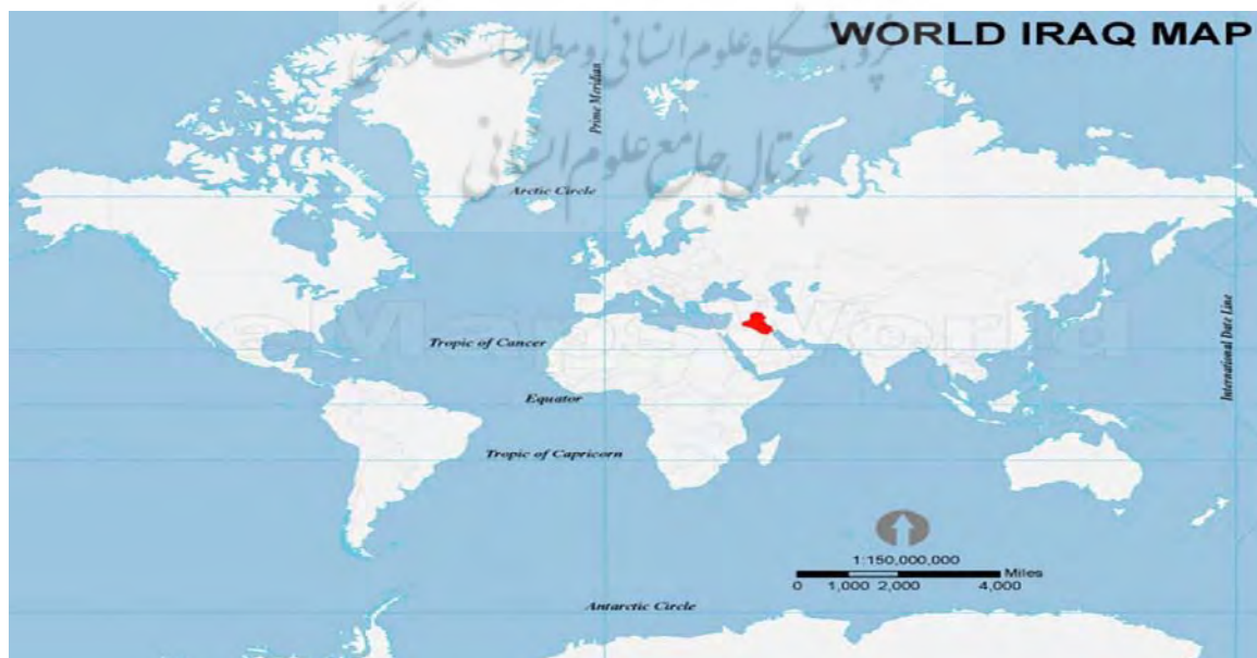
نقشه ۱: موقعیت بین المللی کشور عراق

عراق مابین مدار ۲۹ و ۳۸ درجه شمالی و مدار ۳۹ و ۴۹ درجه شرقی قرار گرفته‌است (بخش کوچکی از آن در غرب مدار ۳۹ درجه شرقی واقع شده). این کشور با ۴۳۷۰۰۷۲ کیلومتر مربع ۵۸امین کشور از حیث بزرگی است. اندازه آن را می‌توان با ایالت کالیفرنیا در ایالات متحده مقایسه کرد. همچنین این کشور کمی از پاراگوئه بزرگتر است (افتخاری، ۱۳۹۱).