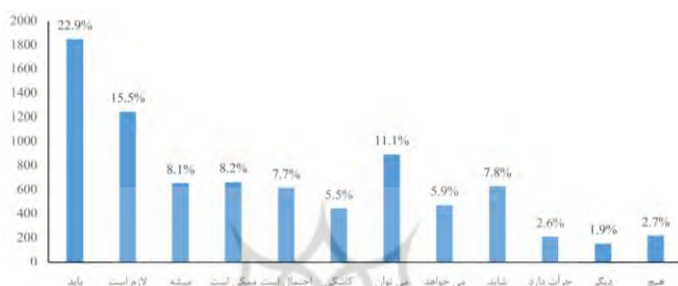
نمودار (۳). فراوانی میزان استفاده از افعال، ساخت‌های بندی و افزوده‌های وجهی

داده‌های آماری مستخرج از تحقیق میدانی (در استان کردستان و اقلیم کردستان عراق) نشان از تمایل زبان کردی به بهره‌گیری از افعال وجهی و ساخت‌های بندی شبه‌دستوری شده برای بیان وجهیت دارد. فراوانی میزان استفاده گویشوران از افعال و ساخت‌های بندی وجهی به صورت نمودار زیر است: