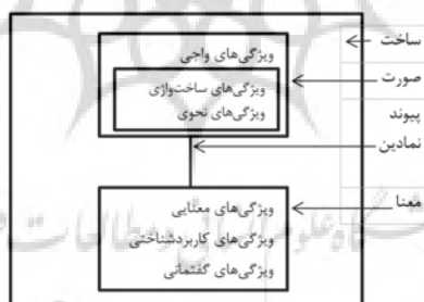
شکل ۱- ساخت در رویکرد صرف ساختی (کرافت، ۲۰۰۷: ۴۷۲)

میکائلز ۹ و لم‌برشت ۱۰ (۱۹۹۶: ۲۱۶) دستور ساختی را بازنمایانندهٔ جفت‌شدگی‌های سه‌بخش صورت-معنی-نقش می‌دانند که در آن تمایز واژه‌ها با ساخت‌های دستوری، تنها با توجه به پیچیدگی درونی‌شان تشخیص داده می‌شود. این بازنمایی ساختی که بر هم‌ارزی صورت-معنی تأکید دارد، یادآور مفهوم نشانهٔ سوسوری است که بعدها لانگاکر ۱۱ (۱۹۸۷) در انگارهٔ دستور شناختی به آن بازمی‌گردد، بر عدم تقدم و تأخر صورت و معنی بر یکدیگر تأکید دارد. این برداشت در مقابل انواع رویکردهای صورت‌گرا از جمله زایشی و رویکردهای نقش‌گرا قرار می‌گیرد. در صرف ساختی نیز اعتقاد بر این است که جفت‌های نظام‌مند صورت و معنی با هم فعال می‌شوند و زبانوران آن‌ها را به‌عنوان الگویی تعمیمی از مقوله‌های ساخت‌واژه‌ای پیچیده اتخاذ می‌کنند. از نظر جکندوف (۲۰۰۷) و کولی‌کاور و جکندوف (۲۰۰۵، ۲۰۰۶) در سطح واژه‌ها، صورت-معنی حاصل جفت‌شدگی سه نوع اطلاعات معنایی، واجی و واژ-نحوی است. ساخت‌واژه بر هر سه نوع این اطلاعات تأثیرگذار است. بدین ترتیب، به معماری سه‌سویهٔ دستور نیاز است. بر همین اساس، بوی (۲۰۱۰) تمامی اطلاعات و ویژگی‌های هر واحد ساختی به مثابه نشانهٔ زبانی را به شکل زیر بازنمایی می‌کند.