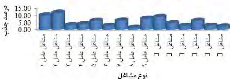
شکل ۲. درصد جذب شهروندان به گروه‌های عمده شغلی در بازار تاریخی تبریز