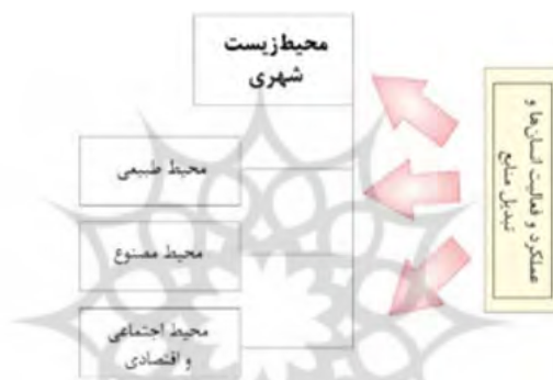
شکل ۱. مفهوم محیط‌زیست شهری

محیط‌زیست، محیطی است که فرآیند حیات را در بر گرفته و با آن برهم‌کنش دارد. محیط‌زیست از طبیعت، جوامع انسانی و نیز فضاهایی که با فکر و به دست انسان ساخته شده‌اند، تشکیل یافته است که انسان به‌طور مستقیم و غیرمستقیم به آن وابسته است و زندگی فعالیت‌های او در ارتباط با آن قرار دارد (ملکی و سعیدی، ۱۳۹۵).