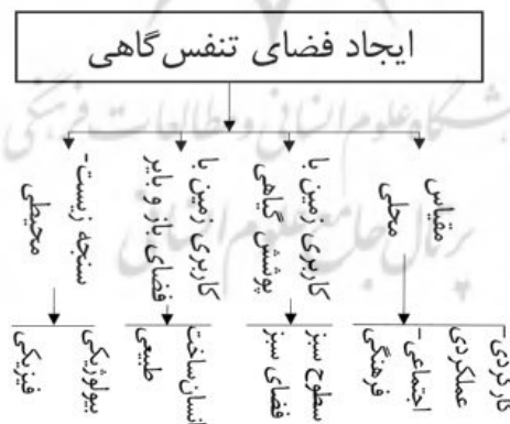
شکل ۳. تشکیل سلسله مراتب

امتیاز را در بین زیرمعیارها داشتند. با توجه به شناخت حاصل شده از پیمایش در محلات با استفاده از عکس برداری و پرسش از مسئولین، مطالعه اسناد کتابخانه‌ای و آرشیمی شهر قزوین، مصاحبه و نتایج حاصل از پژوهش در خصوص معیارها و زیرمعیارهای به دست آمده و