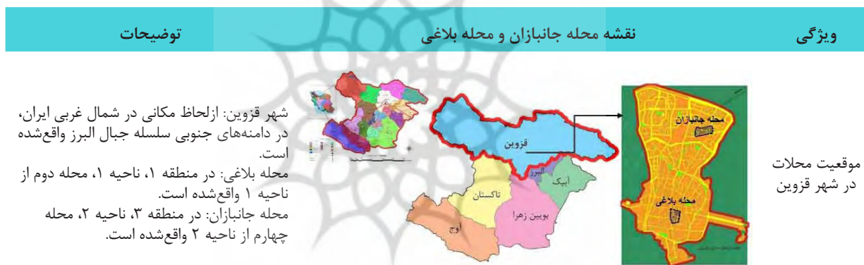
جدول ۴. شناخت نمونه‌های موردی (مأخذ: رفیعیان و همکاران، ۱۳۹۱ و مهندسین مشاور شهر و برنامه، ۱۳۹۴ و حوزه معاونت معماری و شهرسازی قزوین، ۱۳۹۷)

در این پژوهش معیارها بر اساس یک مدل تحلیلی از مفاهیم به‌دست‌آمده‌اند. این مدل تحلیلی مطابق با مطالعات کتابخانه‌ای تنظیم شده است. بر اساس شکل ۲، شاخص‌هایی که انتخاب می‌شوند ۴ مورد خواهند بود. این شاخص‌ها به همراه زیرشاخص‌های فضاهای تنفس‌گامی به‌صورت زیر هستند. ۱. شاخص کاربری زمین با پوشش گیاهی با زیرشاخص‌های: ۱-۱. کاربری فضای سبز ۱-۲. کاربری سطوح سبز ۲. مقیاس محلی با زیرشاخص‌های: ۱-۲. اجتماعی-فرهنگی (جنبه‌های اجتماعی-فرهنگی مقیاس محلی) ۲-۲. کارکردی-عملکردی (جنبه‌های کارکردی-عملکردی