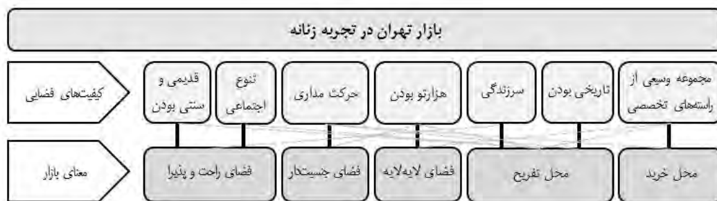
شکل ۳. رابطه معانی بازار با کیفیت‌های فضایی زمینه

بازار به‌مثابه یک فضای تاریخی، با معماری قدیمی و بعضی ساختمان‌های آجری تزئین شده و زیبا، هم به لحاظ زیبایی‌شناسانه بعضی زنان را درگیر خود می‌کند و هم با دربرگرفتن خاطرات و نمادهایی از گذشته، وجهی نوستالژیک می‌یابد و زنانی را در جستجوی خاطره‌ها به قدم زدن در هزارتوی خود فرامی‌خواند. بازار به زنان امکان بودن در میان جامعه و لذت بردن از تماشای شور و هیاهوی مردم را می‌دهد. حضور دائمی مردم از گروه‌های مختلف و سرزندگی همیشگی این فضا نویدبخش این است که علی‌رغم همه مشکلات و دغدغه‌های شخصی و اجتماعی زندگی هنوز در جریان است. تنوع اجتماعی بازار به‌عنوان یک محل کار و فعالیت، دسته بسیار متنوعی از مردم را که به گروه‌های سنی، اقتصادی، فرهنگی مختلفی تعلق دارند به خود جذب می‌کند. بازار به‌مثابه یک هزارتو هم به زنان فرصت کشف و گم‌شدن لذت‌بخش و لذت بردن از پیدا کردن فضاها و دنیاهایی جدید از اجناس را می‌دهد و هم با ایجاد کردن یک نظم سلسله‌مراتبی، در مراتب حضور زنان در لایه‌های بازار مؤثر واقع می‌شود. همچنین به این واسطه امنیت در کنار ناامنی ایجاد می‌شود و بخش‌هایی از بافت بازار برای حضور زنان پرمخاطره باقی می‌ماند. بازار به‌مثابه یک فضای قدیمی و سنتی حال و هوایی ویژه دارد که خود را در شکل و