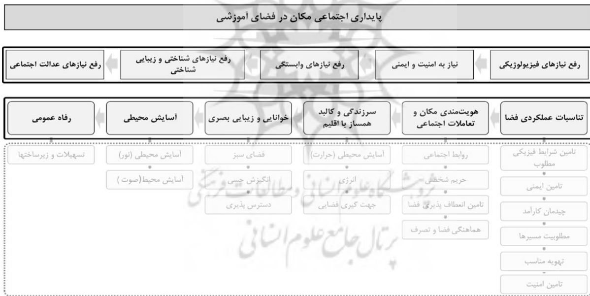
شکل ۶. مدل نهایی شاخص‌های مکانی مؤثر بر ارتقا پایداری اجتماعی مکان در فضاهای آموزشی

معماری دانشگاه هنر اسلامی تبریز طبق مدل ارائه‌شده در شکل ۶ تدوین شد.