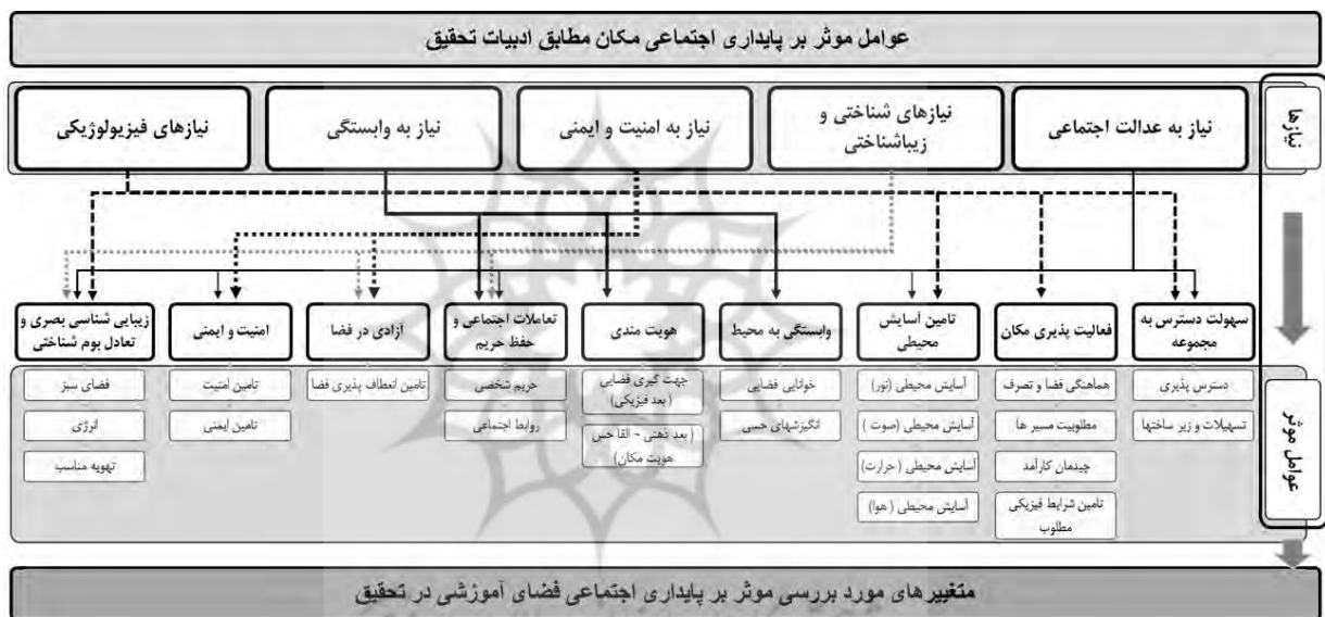
شکل ۴. گزاره‌های مورد بررسی پژوهش