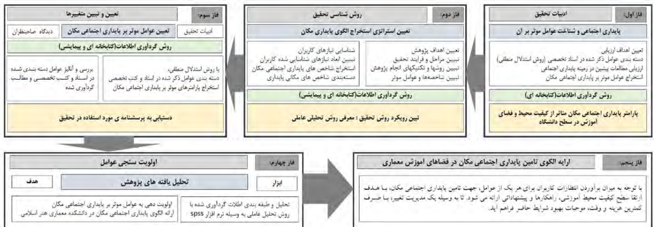
شکل ۱. مدل تحلیلی پژوهش

دکتری، در دو رشته معماری و شهرسازی، با مجموع ۲۸۳ دانشجوی، با فعالیت خود ادامه می دهد. ۲۴ روش نمونه گیری مورد استفاده، روش های ترکیبی بنیادی به دو صورت هدفمند و تصادفی است. ابتدا طبقات و زیر گروهها به صورت تقسیم بندی و با رعایت تناسب تعداد دانشجویان در رشته های معماری و شهرسازی در هر طبقه با توجه به تعداد دانشجویان در مقاطع تحصیلی مختلف تقسیم بندی شده و در مرحله بعد اعضای نمونه از یک جامعه بزرگ تر، به صورت تصادفی برگزیده شده است. مراحل انجام تحقیق (تحلیل عاملی)، جهت اولویت بندی عوامل مؤثر بر پایداری اجتماعی فضای آموزشی دانشگاه هنر اسلامی هدف اساسی استفاده از آزمون آلفای کرونباخ، بررسی میزان همسانی درونی گویه های یک مقیاس است؛ که از طریق فرآیند شاخص سازی تهیه می شود. این ضریب معرف میزان همپوشی پرسش های مختلف