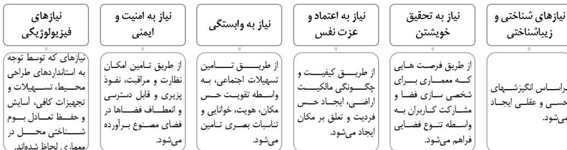
شکل ۲. مدل جان لنگ، جهت تأمین پایداری اجتماعی فضاهای مصنوع