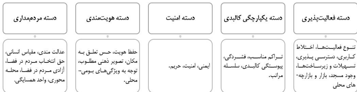
شکل ۳. مدل تدوین‌شده شاخص‌های مکانی پایداری اجتماعی (مأخذ: شیعه و همکاران، ۱۳۹۶، ۱۱۹).