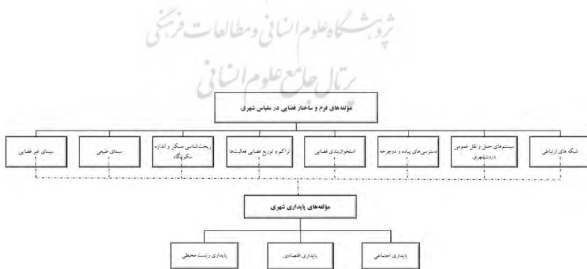
شکل ۱. ارتباط میان مؤلفه‌های ساختار فضایی و فرم شهری با پایداری در شهر تهران