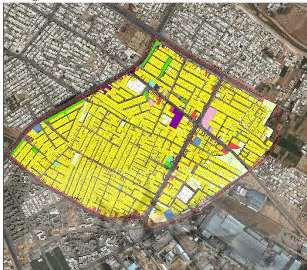
شکل (۲) موقعیت محله شریف آباد در شیراز

محله شریف آباد در موقعیت شرقی شیراز و مرکز منطقه ۷ شهر شیراز قرار دارد. این محله دارای ۱۵۳۰۰ نفر جمعیت می‌باشد. موقعیت قرارگیری محله به طوری است که اکثر ساختمان‌های آن فرسوده شده و در مجاورت محلات فرسوده نیز قرار دارد.