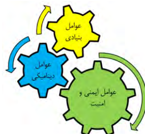
شکل شماره ۱. عوامل اصلی رویکرد ساختارگرا در امنیت شهری (بلیک و همکاران، ۲۰۰۳)

رهیافت‌های ایمنی و امنیت در تأمین امنیت شهری: در بین رهیافت‌های ارائه‌شده برای امنیت یکی از کاربردی‌ترین رهیافت‌ها، رویکرد ساختارگرا می‌باشد. داشتن رویکرد ساختارگرا بر مقوله امنیت، از جمله فعال‌ترین فلسفه‌های مکانی - فضایی در تحلیل مفاهیم انسانی در راستای موضوع ایمنی و امنیت در چند دهه اخیر محسوب می‌شود. مکتب فکری حاضر که از طریق رابطه بین سوانح، سطح توسعه و وابستگی اقتصادی جهان در حال توسعه نشأت می‌گیرد بر این اصل استوار است که افزایش گرفتاری‌های کشورهای جنوب بیشتر به سبب توجه افراد به امور اقتصاد جهانی، گسترش سرمایه‌داری و در حاشیه قرار گرفتن مردم فقیر است تا اثر حوادث ژئوفیزیکی (اقبال، ۱۳۹۴: ۳۳). از مهم‌ترین نظریه‌پردازان این رویکرد می‌توان به توبین و مونتر اشاره کرد که در سال ۱۹۹۷ با نگاهی ساختاری روند شکل‌گیری و تشدید آسیب‌های مکانی را متأثر از سه اصل عمده به شرح شکل زیر تحلیل کرده‌اند.